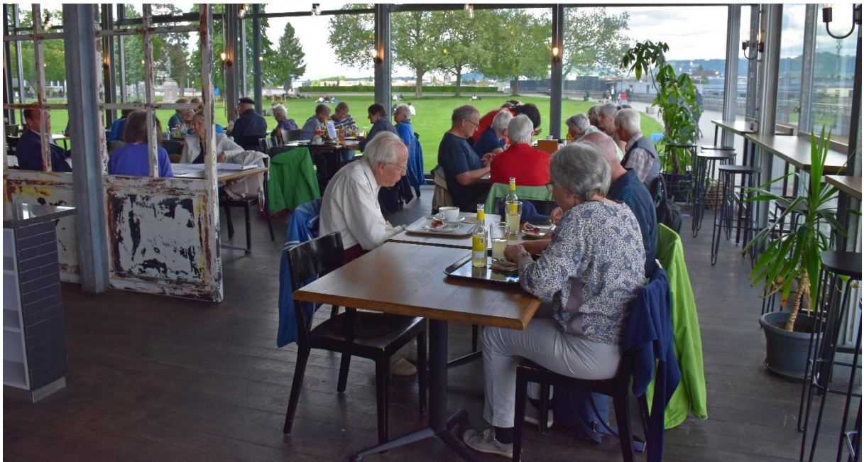
Zveri im Restaurant auf der Grossen Schanze