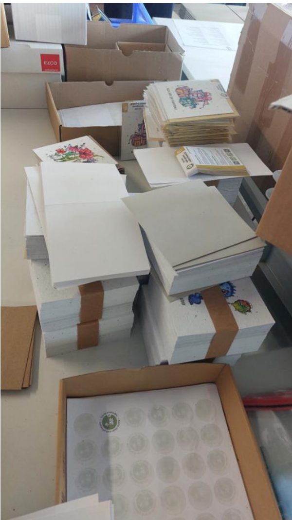
Ein Kartensortiment. Die Karten können in diversen Läden gekauft werden.