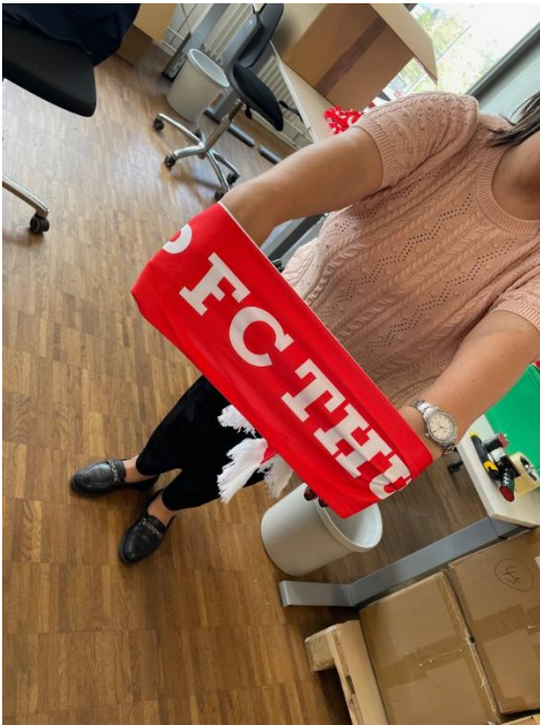
Auch der FC Thun ist vertreten und macht sicher einigen Menschen hier sehr Freude