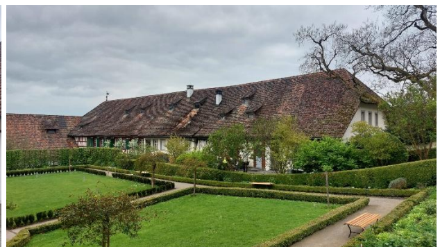
Wir trinken Kaffee oder Tee mit einem Stück Kuchen, kaufen im Klosterladen Spezialitäten ein, bummeln im Klostergelände, dem Heilpflanzengarten, dem Barockgarten, dem Labyrinth ...