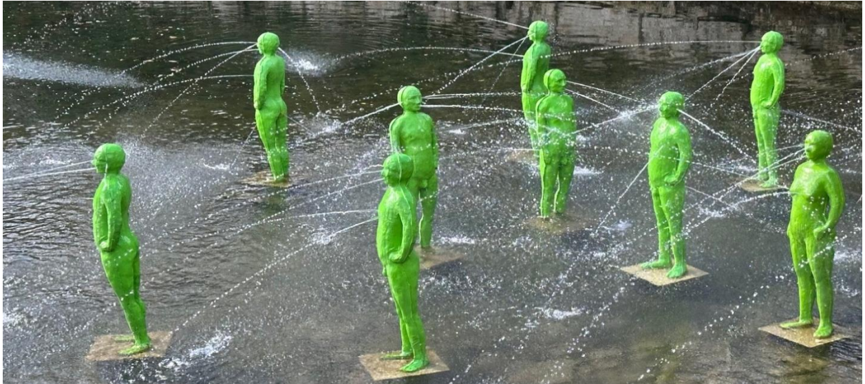
Les hommes vert des französischen Künstlers Fabrice Hyber im Brunnen der Kartause. Für die Ausstellung im Kunstmuseum reicht die Zeit nicht.

Fabrice Hyber (*1961) gehört zu den weltweit anerkanntesten französischen Künstler:innen. Aus einer Familie von Schafzüchter:innen stammend, kaufte er in den 1990er Jahren in der Vendée-Region 100 Hektaren Land. Dort kultiviert Hyber seither seinen Urwald „La Vallée“. In seinen Werken tragen die Bäume statt grüner Blätter blaue Kreise, die für den von der Pflanze produzierten Sauerstoff stehen. Hybers Schöpfungen sind Zwischenstufen eines Arbeitsprozesses, in dem das Denken als eine Art Wurzelstock mit seinen Ausläufern und Windungen angelegt ist.