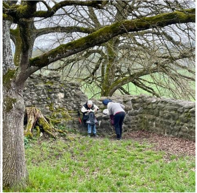
Ein Grüppchen fährt von Buch mit dem Bus zur Kartause Ittingen. Die anderen wandern weiter.