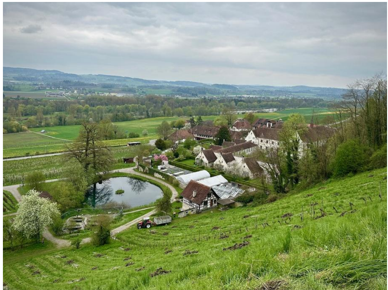
Von der Kirche St. Martin (1471 erbaut) aus sieht man wunderbar auf die Kartause Ittingen.