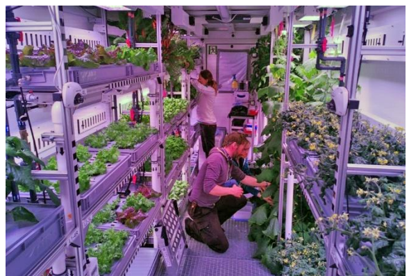
Laborbedingungen für Gemüse!