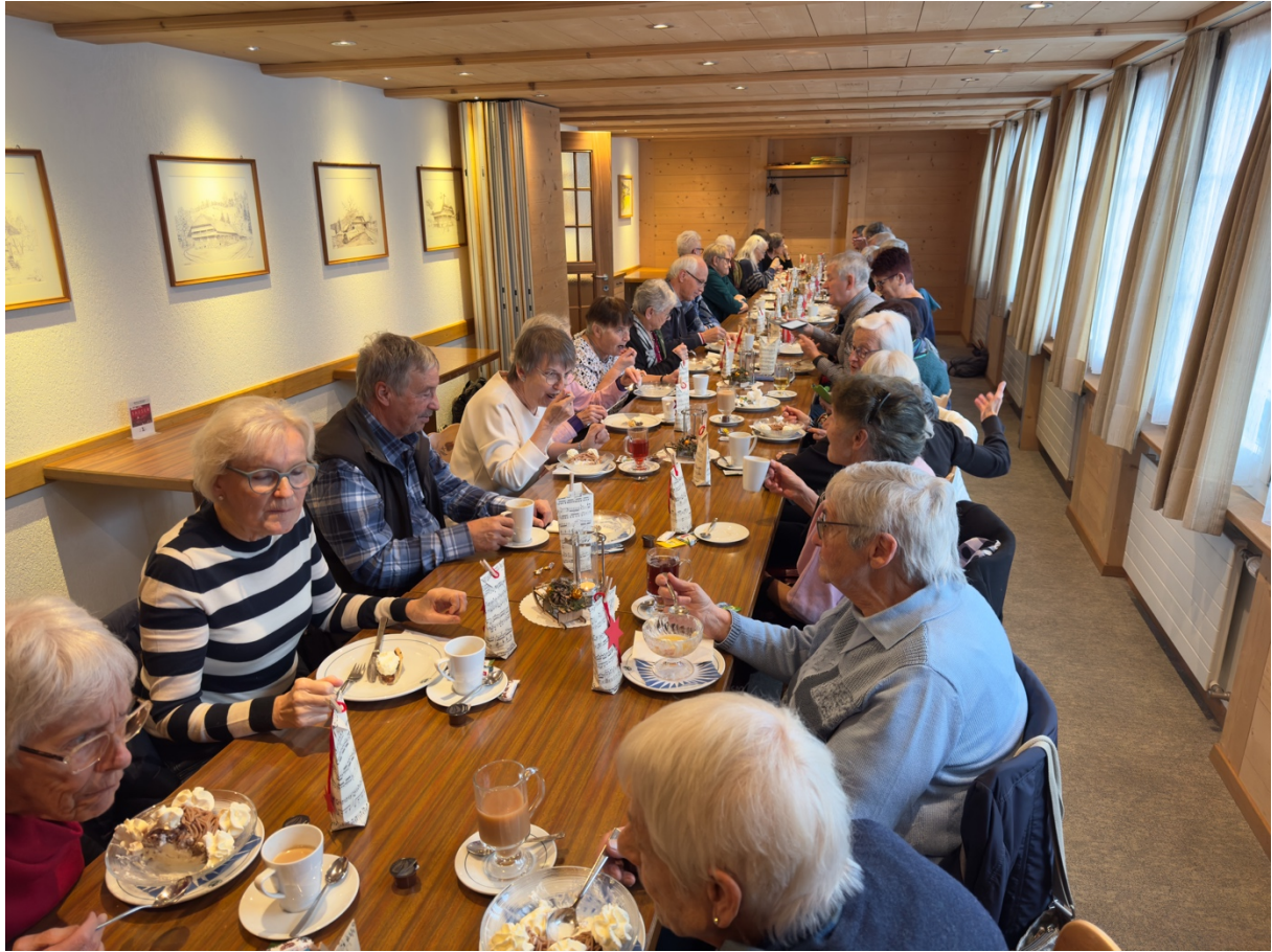
Bei einem feinen Zvieri im Restaurant Hirschen liessen wir die Adventsfeier ausklingen.