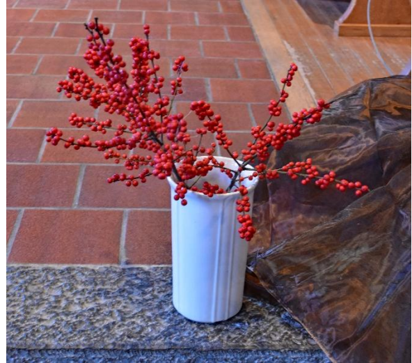
Details aus der Kirche