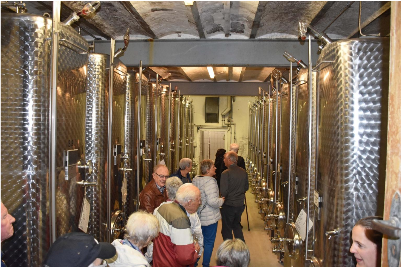
Besuch und Degustation bei den Tanks. Chromstahlfässer sind vor allem für Weissweine besonders geeignet.