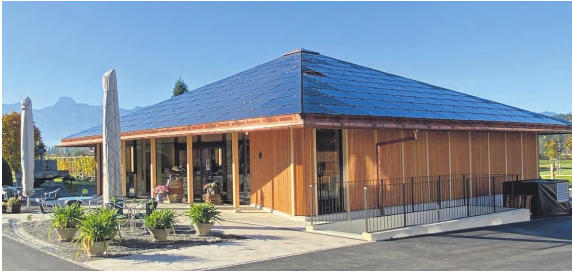
Der Wyszopf – Verkaufs- und Eventlokal zugleich!

Im Untergeschoss erwartete uns in einem schönen Raum mit Eichenfässern ein leckeres Zvieri mit einer weiteren Weingustation.