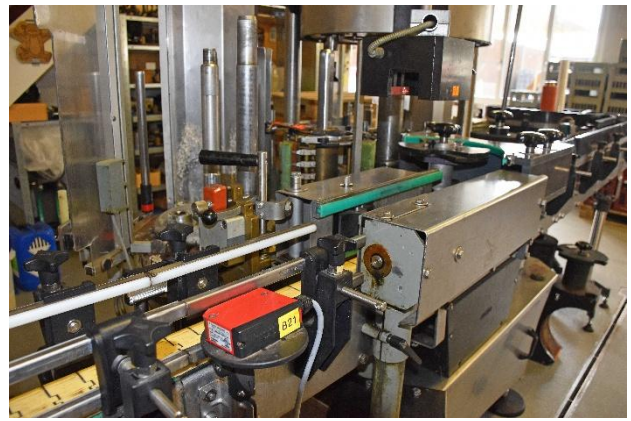
Hier werden die Weine in Flaschen abgefüllt.