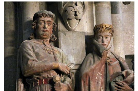
Ekkehard und Uta