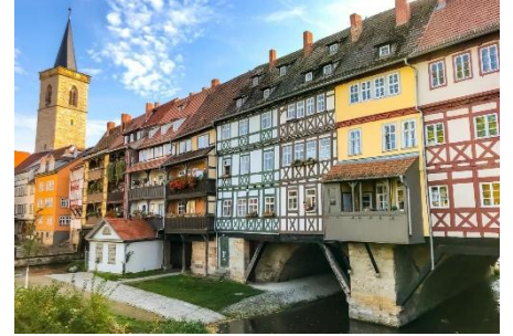
Erfurt - Krämerbrücke