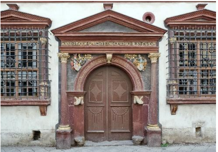
Erfurt - -Haus zum Kroenbacken