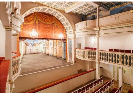
Gotha - Ekhof-Theater