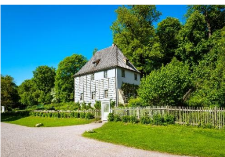
Weimar Gartenhaus von Goethe