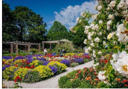
Erfurt - EGAPark