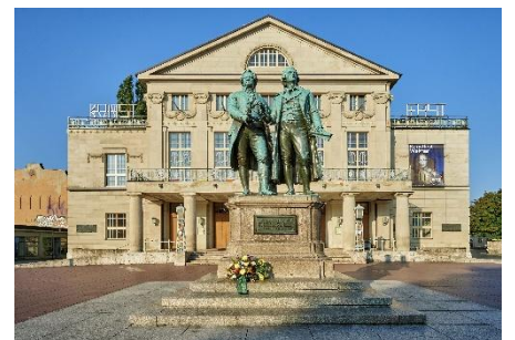
Weimar Goethe und Schiller