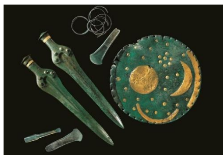
Nebra Himmelscheibe u.a.