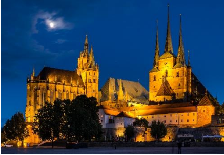
Erfurt - Dom und Severikirche