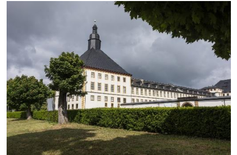
Gotha - Schloss Friedenstein