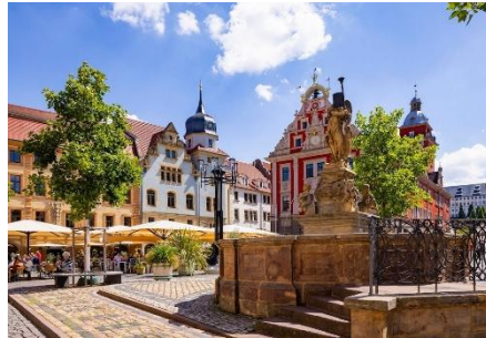
Gotha - Altstadt