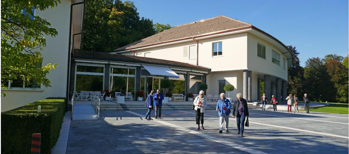
2x pro Tag kommt sogar das Postauto bei der Abegg-Stiftung vorbei!