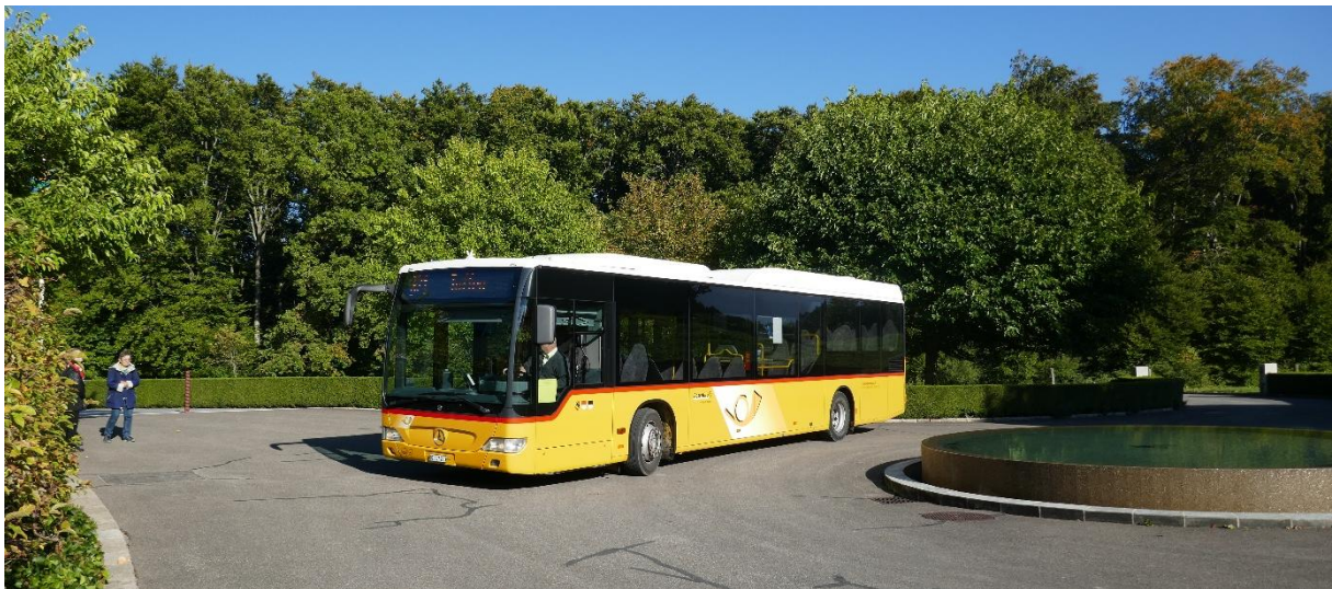
Gemütlicher Ausklang im «Kafi Riggli» im Dorfzentrum von Riggisberg