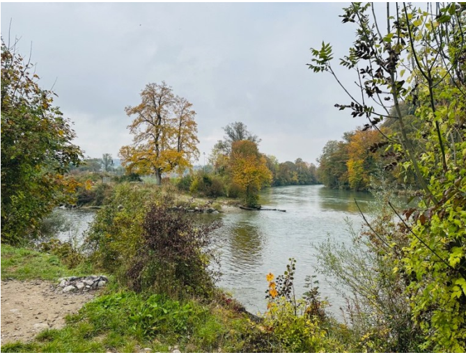
Zusammenfluss von Sense und Saane

Nach der Kafipause in Laupen wandern wir zuerst der Sense und dann der Saane entlang Richtung Flühelenmühle.