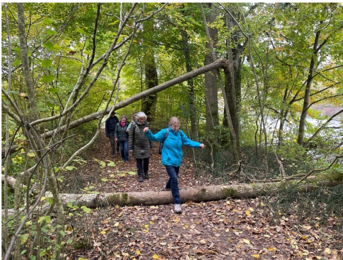
Elegant über das Hindernis