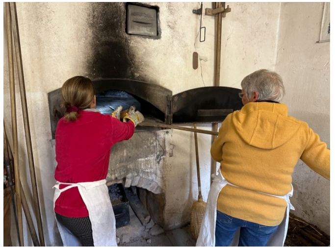
Während unserer Führung wird im heissen Ofen Brot gebacken.