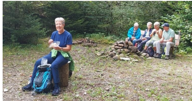
Ein erster Zwischenhalt für die hungrigen und durstigen Wanderer