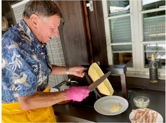
Weiter geht's mit feinem Salat und Walliser-Raclette mit oder ohne Speck, perfekt abgestrichen.