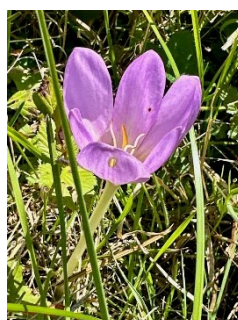
Eine etwas verfrühte Herbstzeitlose ;-)

Die andere Gruppe wandert weiter zum Stausee Ze Binne, vorbei an der Kapelle St. Sebastian, durch prächtige Blumenwiesen, durch den Wald und schliesslich über die schöne historische Binna Brücke nach Binn.