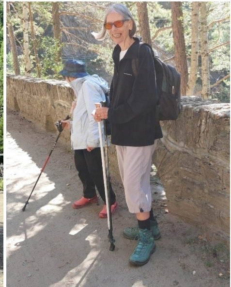
Die zwei sind auch mit Neunzig noch fit!