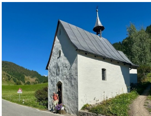
Kapelle Mariä Verkündigung