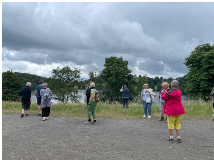
Blick auf eine der Dauner Maare