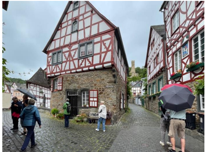
Spaziergang durch Monreal