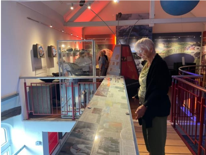
Museum «Vulkanhaus» in Strohn

Leider wechselte das Wetter, so dass die Vulkan-Eifel mehrheitlich aus dem Bus zu besichtigen war. Die Entstehung der Vulkane und deren Maare wurden uns eindrücklich erklärt.