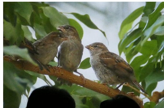
Ein paar Schnappschüsse aus der Vogelwarte...