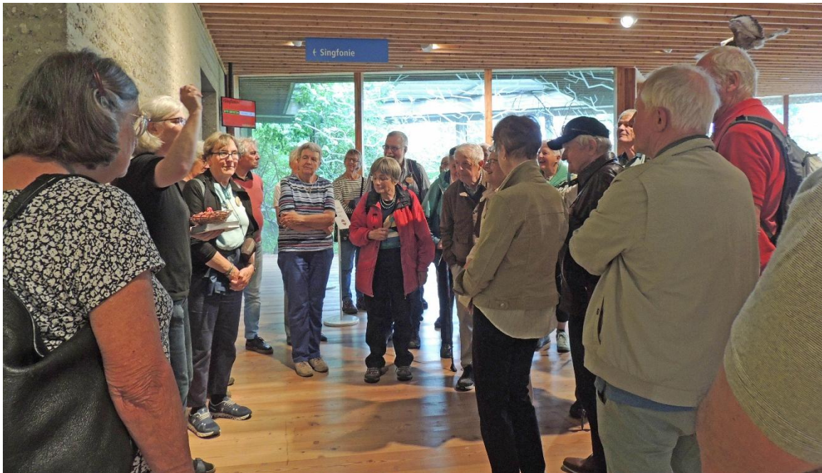
Start zur individuellen Besichtigung der interaktiven Ausstellung in der Vogelwarte