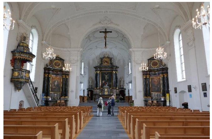
Spaziergang durch Sempach