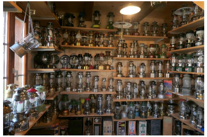
Beispiele aus der umfangreichen Sammlung