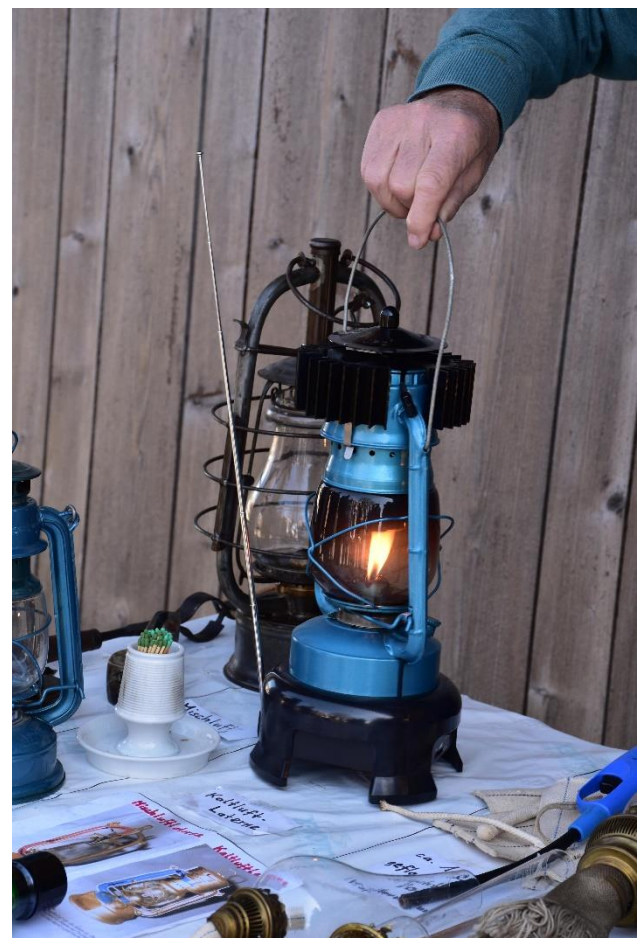
Sensationell: die Lampe rechts funktioniert mit ausgefahrener Antenne sogar als Radio!!