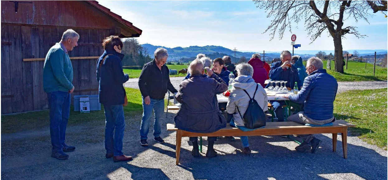
Herzlichen Dank den Gastgebern für das feine Zvieri