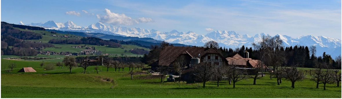
Aussicht vom Wasserreservoir über den Wislenhof zu den Berner Alpen