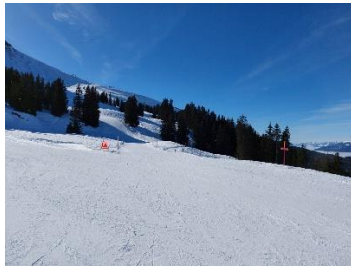
Ohne Worte, einfach nur schön und zum genießen