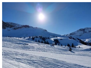
Mit Eiskrallen und Stöcken ausgerüstet nehmen wir den Wanderweg in Angriff