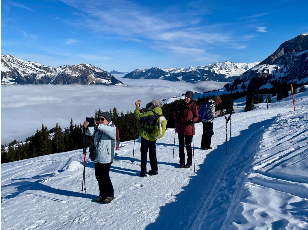
Und immer wieder finden wir Fotosujets...