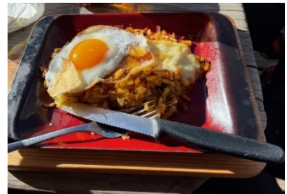
Im Restaurant Hilten machen wir Mittagsrast und können dank angenehmen Temperaturen draussen essen