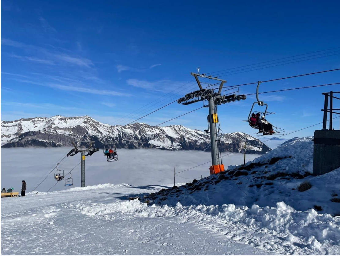
Blick aufs Nebelmeer