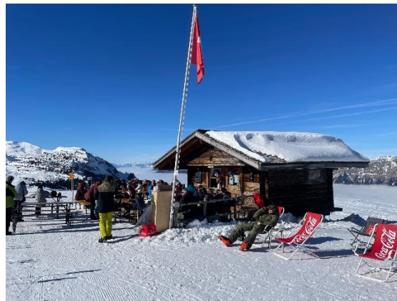
Hier wurden wir sehr freundlich bewirtet