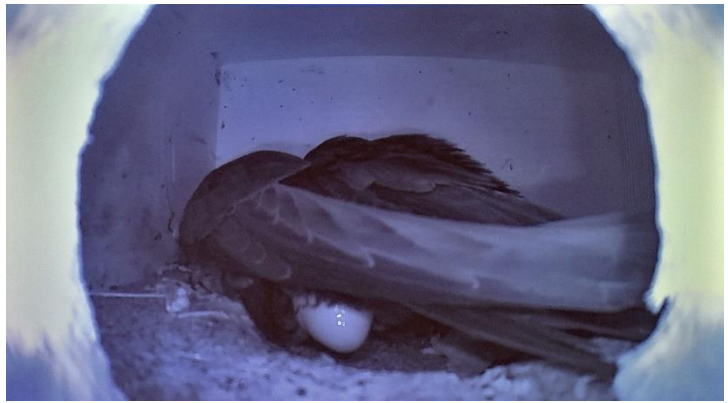
Patrik Burkhardt ist es gelungen die Eiablage zu filmen