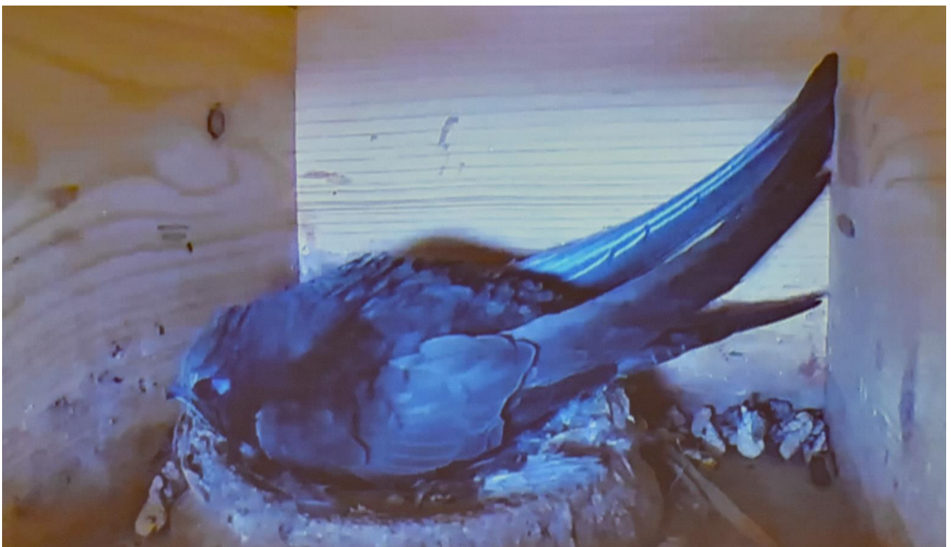
Es ist unglaublich, was der kleine Mauersegler alles vollbringt...!