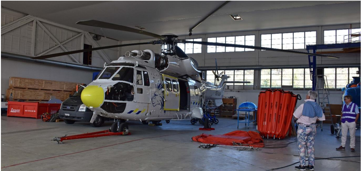
Auf dem Flughafen gibt es verschiedene Helikopterbasen