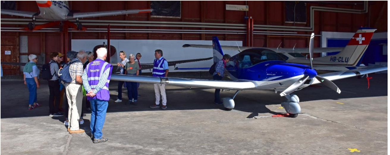
Wir bestaunen ein neues Schulungsflugzeug