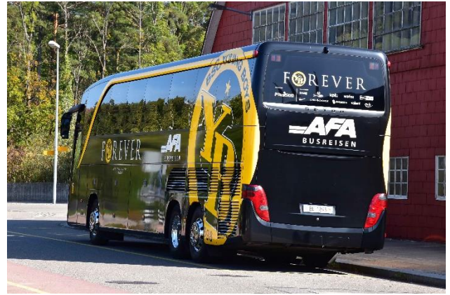
Gespannt warten die YB-Fans, der YB-Car und wir (in 2 Gruppen) auf die Ankunft der beiden Chartermaschinen mit der YB- Mannschaft aus Belgrad