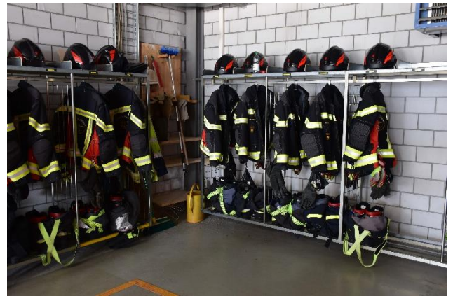
Der Flughafen besitzt selbstverständlich eine eigenständige einsatzbereite Feuerwehr