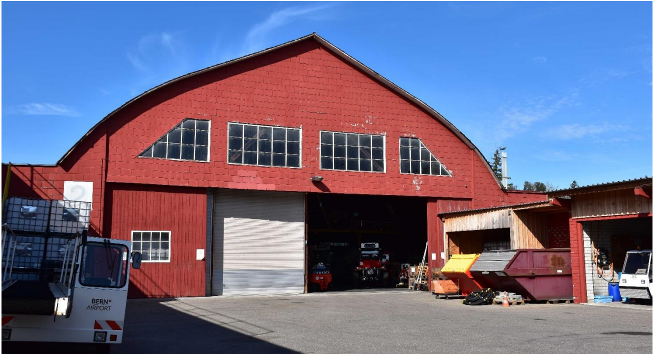
Der 1928 gebaute und geschützte Oskar Bider Hangar wird heute noch als Abstellraum genutzt.