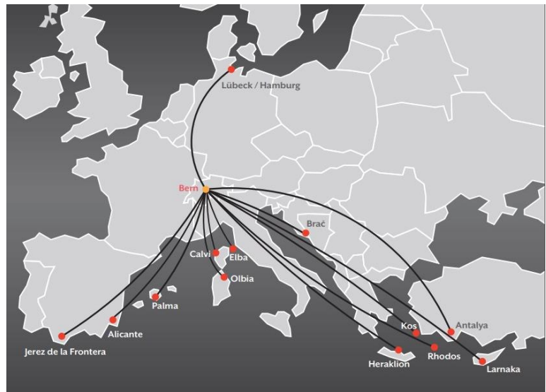
Ab Bern Airport in die Ferien! Oben rechts Ferienorte, die von den Fluggesellschaften von Bern aus angefliegen werden. Daneben gibt es auch diverse Privatflüge.