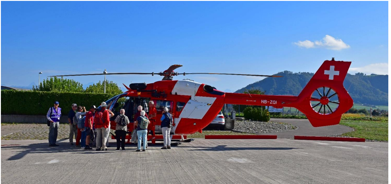
Auch eine REGA-Basis ist hier