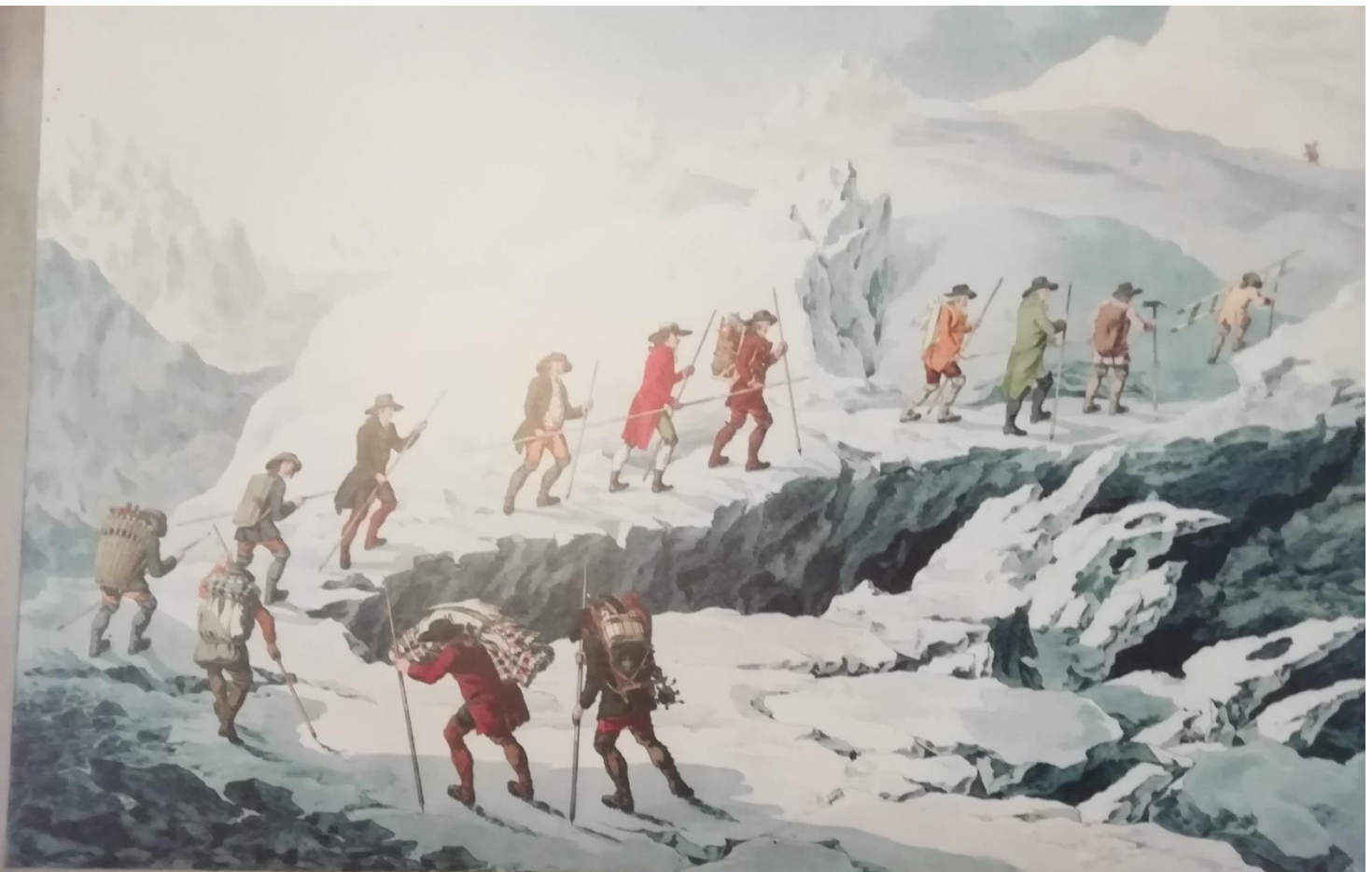
VOYAGE DE M r DE SAUSSURE A LA CÎME DU MONT-BLANC AU MOIS D'AOUT MDCCLXXXVII. Planche Ce célèbre Physicien Genevois accompagné de l'entrepreneur Jacques Balmat dit le Mont-Blanc et de dix sept autres Guides, monta cette fameuse Montagne, et après une marche pénible et dangereuse qui dura 18 heures, il en atteignit la cime élevée de 2430 Toises environ au dessus du niveau de la mer. Publié par ordre de l'Académie des sciences et belles-lettres de Genève.