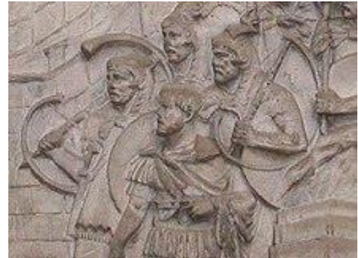
Cornua auf der Trajanssäule in Rom