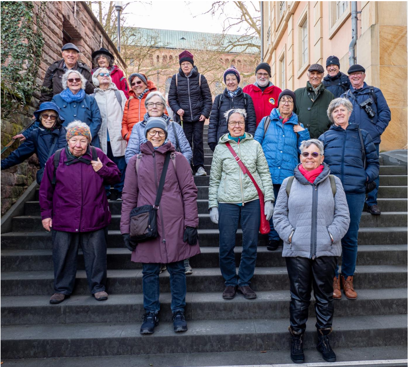
Mit dem Stadtführer in Speyer unterwegs

Kurz, wir lernten bei hervorragenden Führungen viel Neues kennen, hatten aber auch genug Zeit zum Plaudern, Shoppen und Kaffeetrinken, nicht zu vergessen die unwiderstehlichen Kuchen.