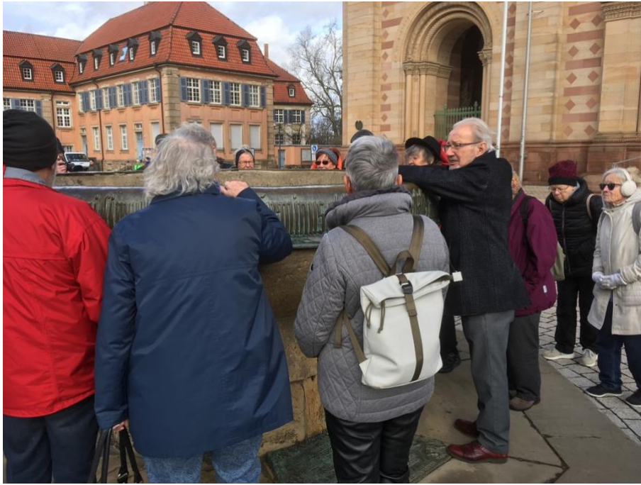
Domnapf vor dem Hauptportal: Die Domnapffüllungen mit Wein sollten bei besonderen kirchlichen Anlässen Lust und Fröhlichkeit unter dem Volk verbreiten. Der Ausdruck «bechern» bekommt so eine Bedeutung.