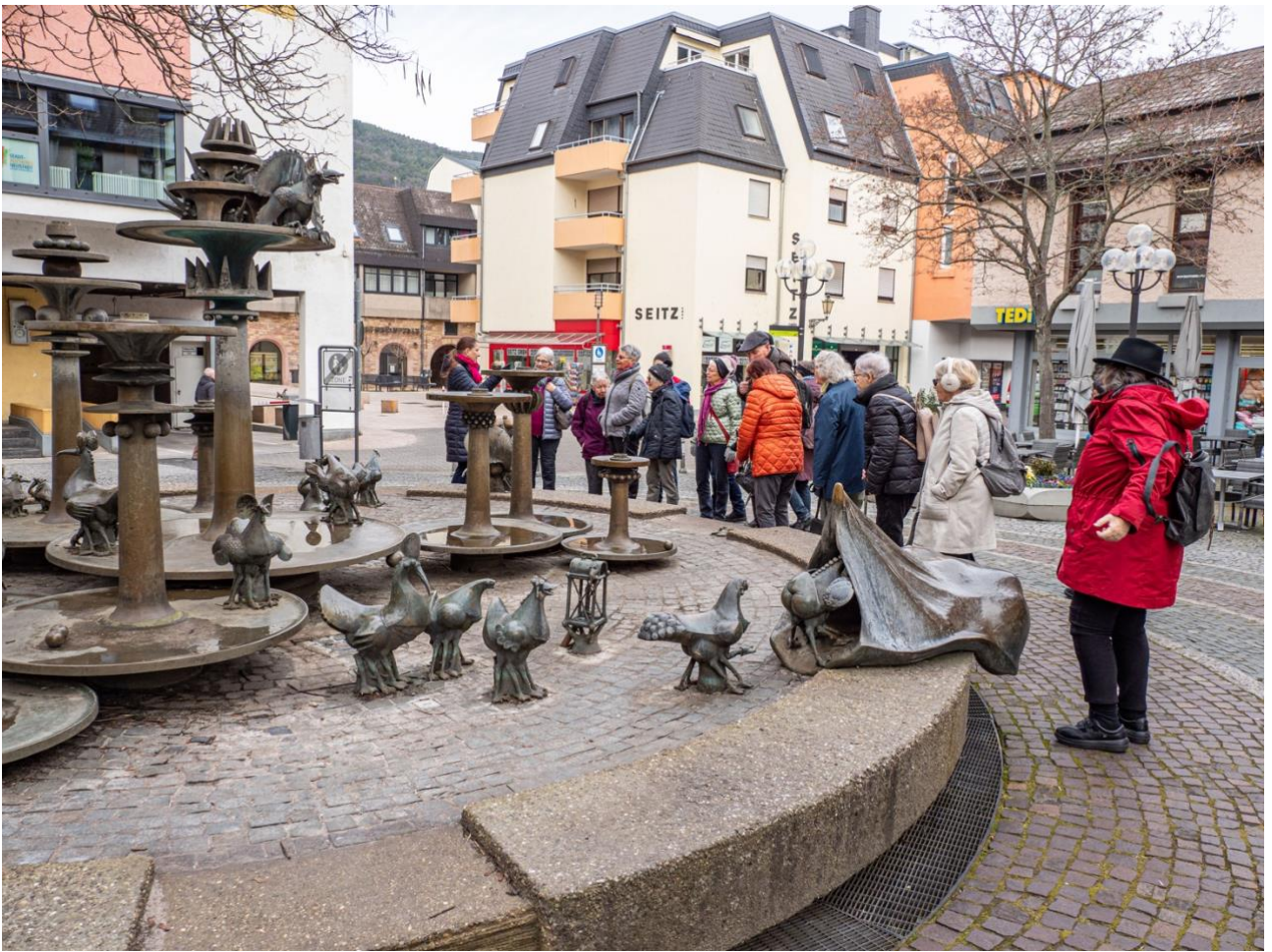
Elwetrutsche-Brunnen mit Fabelwesen in Neustadt