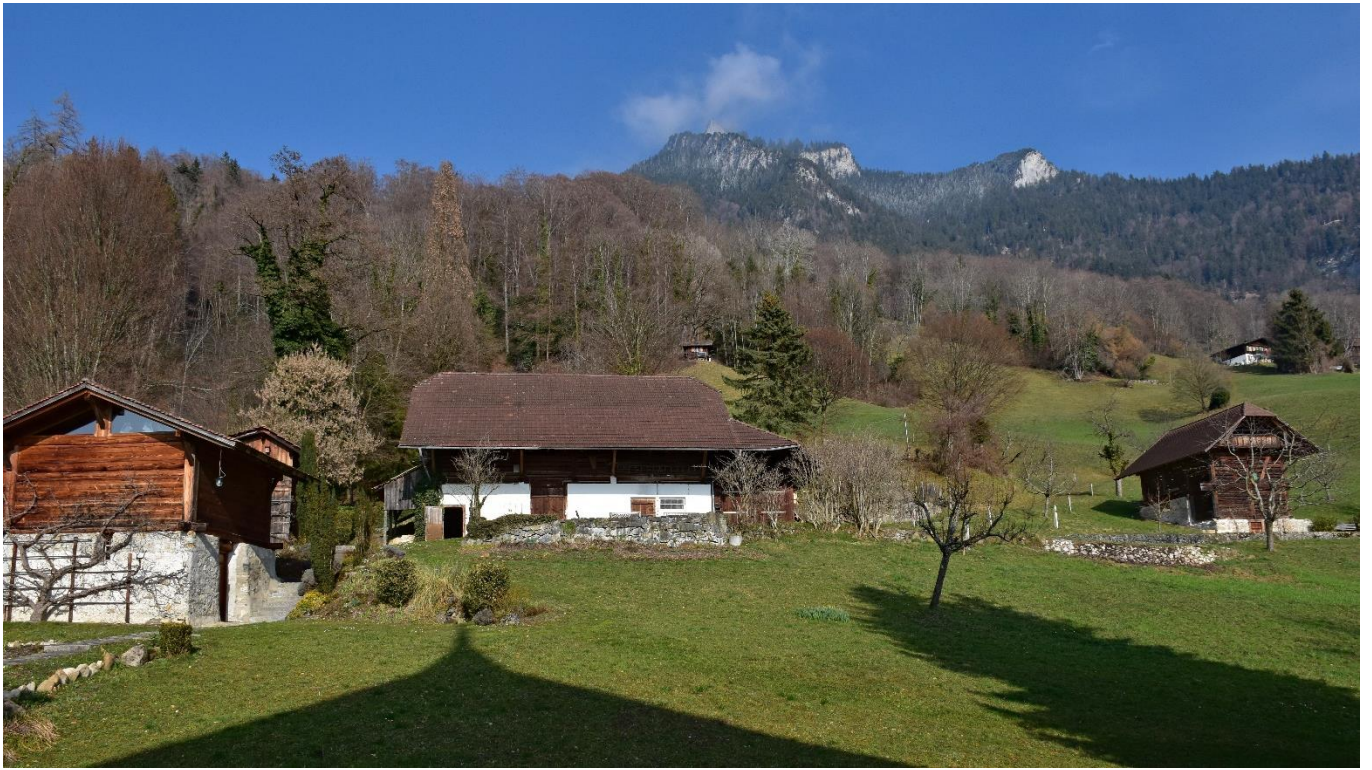
Neben viel Wald und verpachtetem Land gehören auch diverse Nebengebäude zum Schlossgut