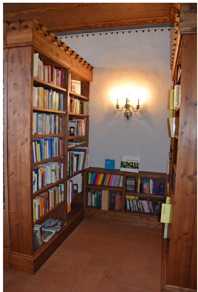
In der Bibliothek