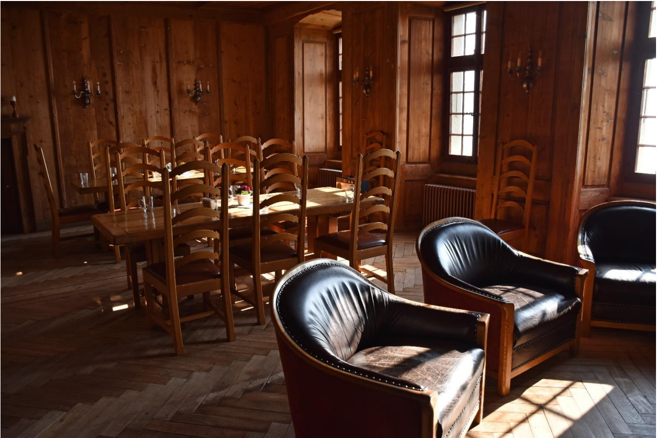
Blick ins Refektorium