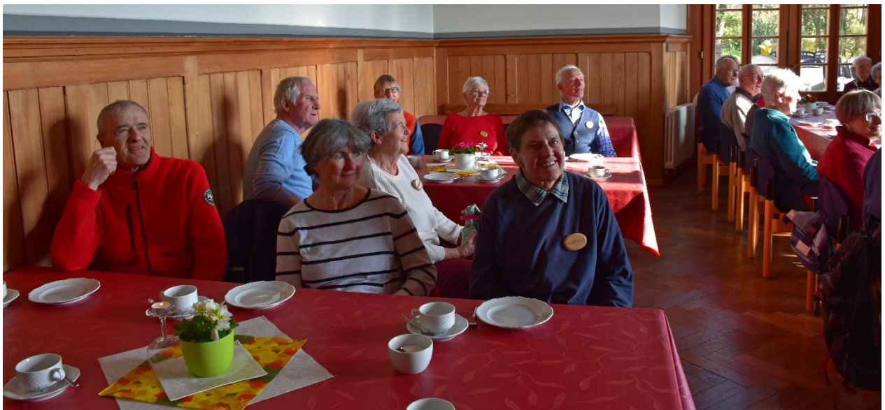
Als Abschluss geniessen wir das feine Zvieri mit Kaffee und dem leckeren selbstgebackenen Mandarinen-Quark-Streuselkuchen