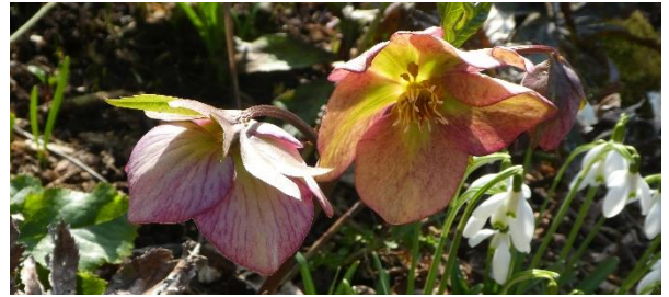
Impressionen aus dem gut gepflegten Schlosspark