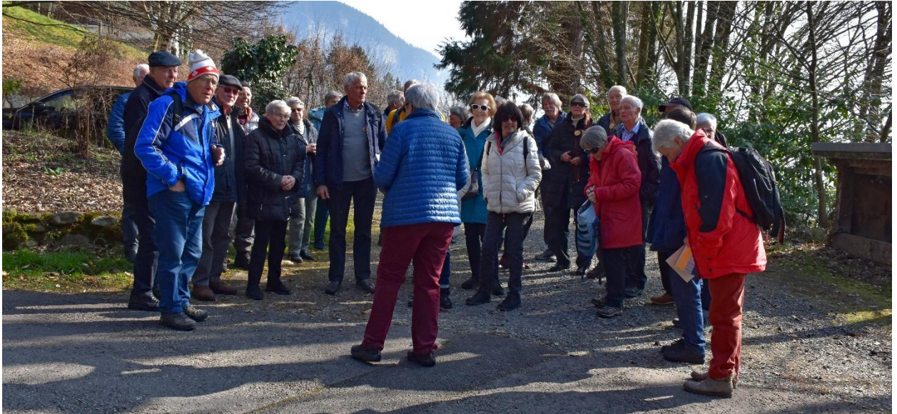
29 Pensionierte warten gespannt auf den heutigen Nachmittag