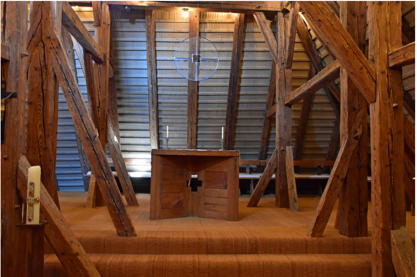
Die Kapelle befindet sich im Dachstock des Hauptgebäudes