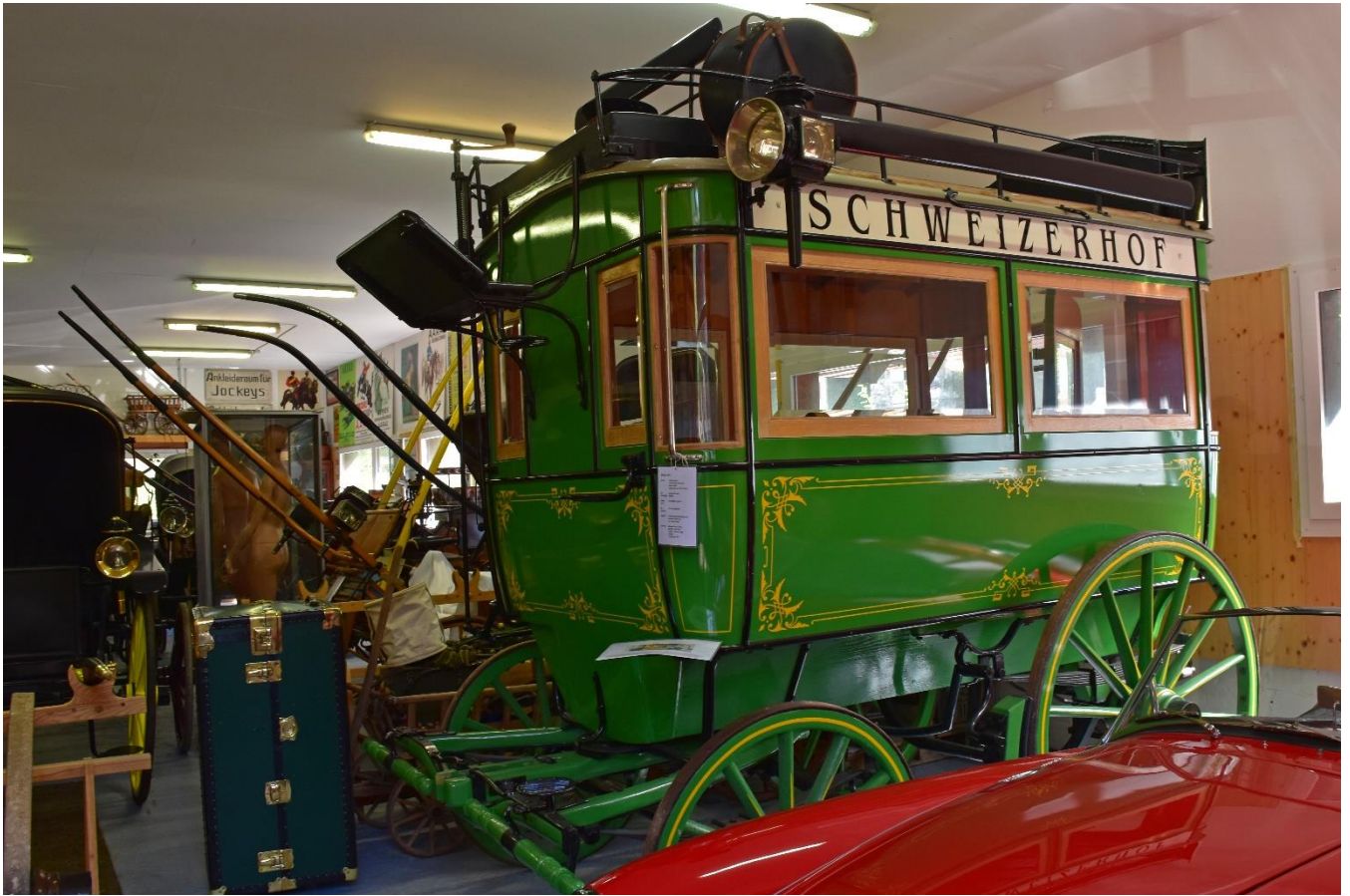
Hotel Omnibus «Schweizerhof Interlaken»