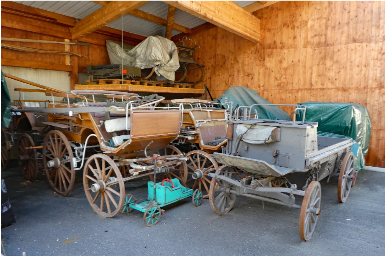
Diese Wagen draussen sind noch nicht restauriert..... Es gibt noch viel zu tun!