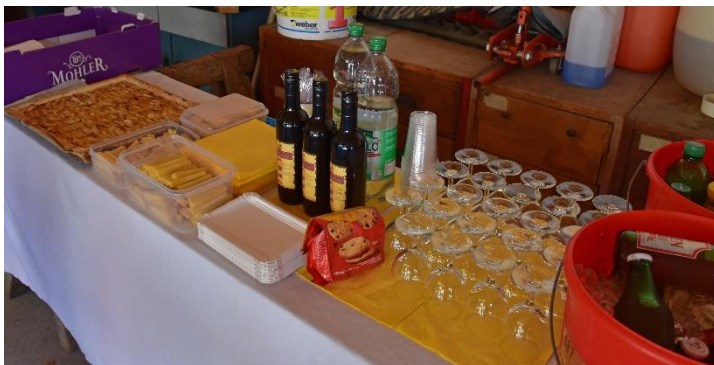
Nach der Führung wartete ein Zvieri auf uns!