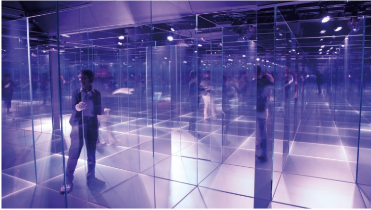
Einige besuchen danach das Glaslabyrinth, das Glasarchiv,