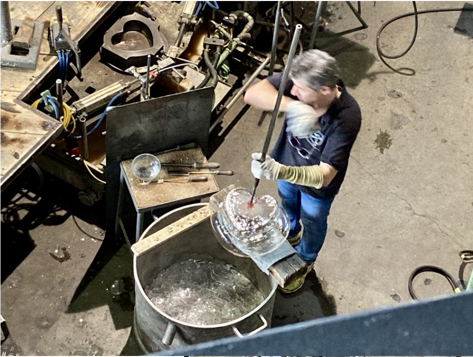
Den Glasbläsern um den riesigen Ofen herum könnte man von der Empore aus stundenlang zuschauen.