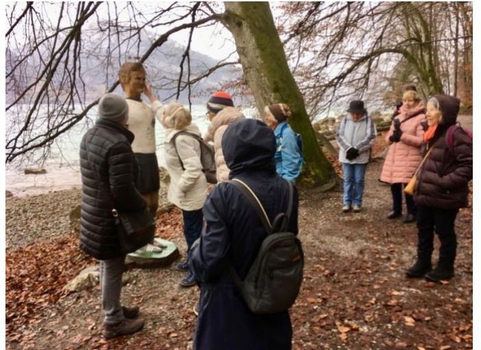
In der Spiezerbucht