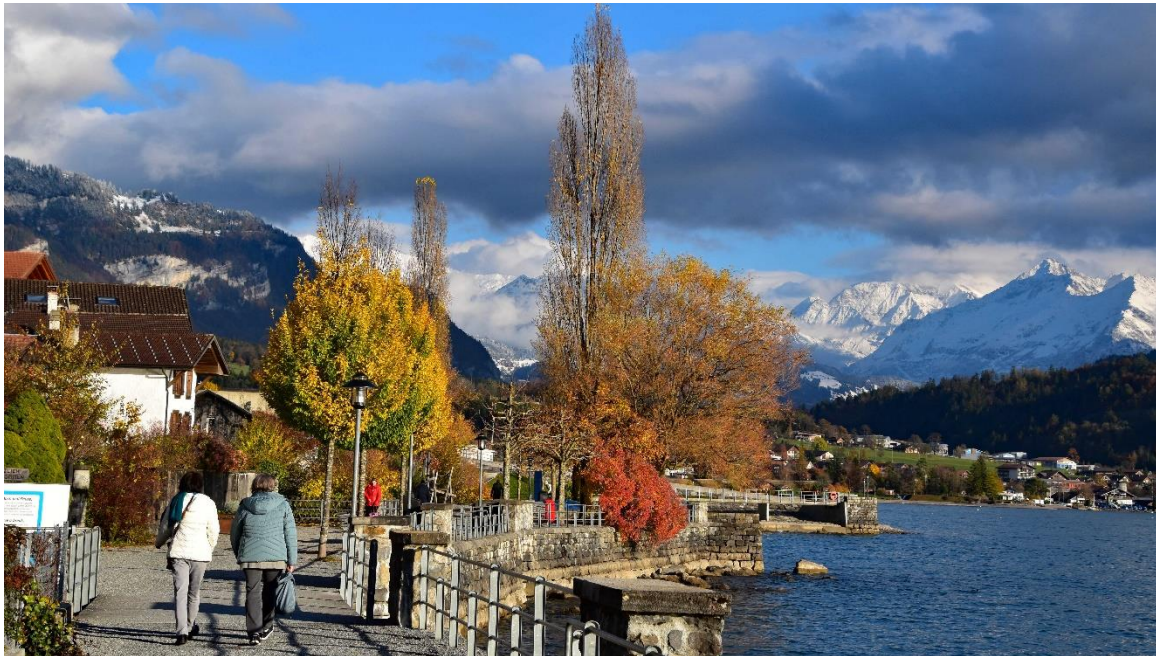
Nach der Führung spazieren wir dem See entlang zum Zvierihalt im Weissen Kreuz