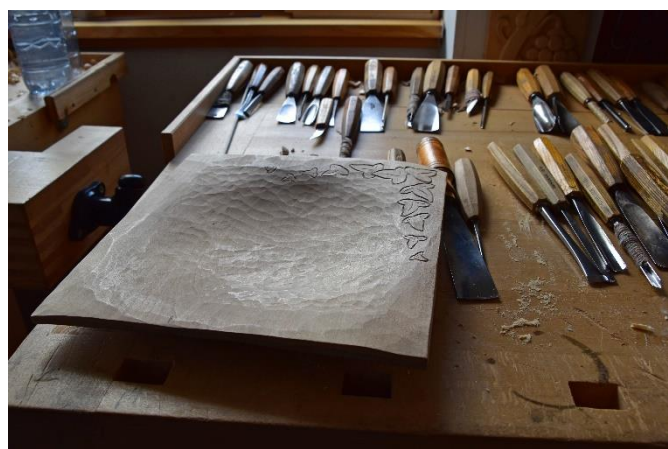
Jedem Lehrling steht ein eigenes Werkzeugsortiment zur Verfügung