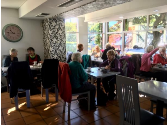
Nach dem obligatorischen Startkaffee in Allaman

18 Frauen steigen bei bedecktem Himmel in Thun optimistisch in den Zug Richtung Welschland, wo sie gut zwei Stunden später bei strahlendem Sonnenschein aussteigen.