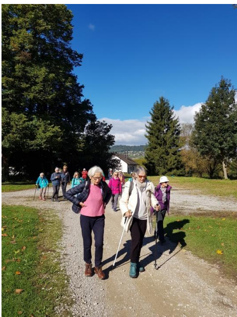
in Richtung Flüsschen Aubonne und Genfersee