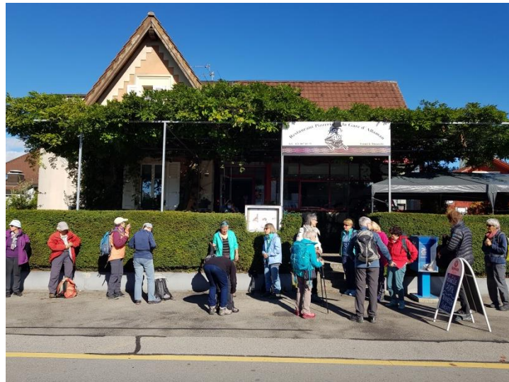
brechen wir frohgemut auf