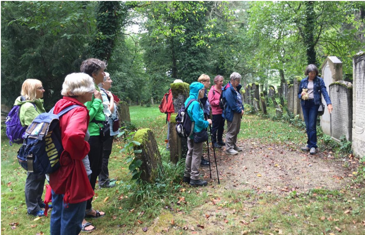
Auf dem Israelitischen Friedhof erfahren wir ebenfalls viel Interessantes und genießen die wunderschöne und ruhige Atmosphäre zwischen den alten Grabsteinen und Bäumen.