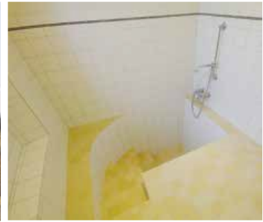
Das ehemalige jüdische Schulhaus, das Mikwe (rituelles Tauchbad) mit lebendigem Wasser