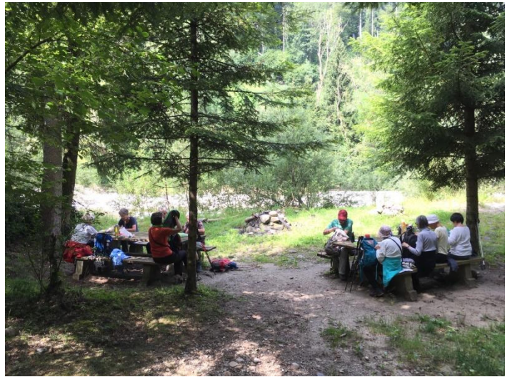
...zu einem gemütlichen Picknickplatz in Ufernähe.