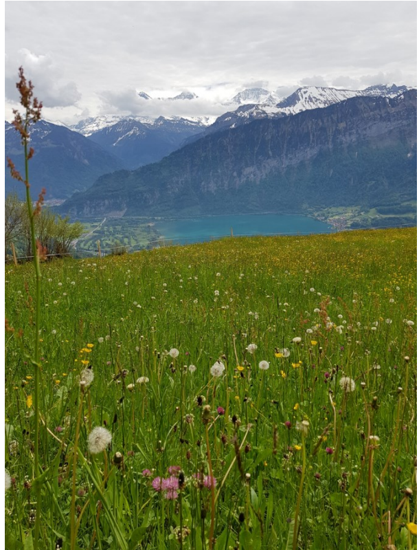
Eifach nume schön! Warmi Sunne, farbegi Matte, Grille, wo zirpe, Ussicht uf d Bärge...