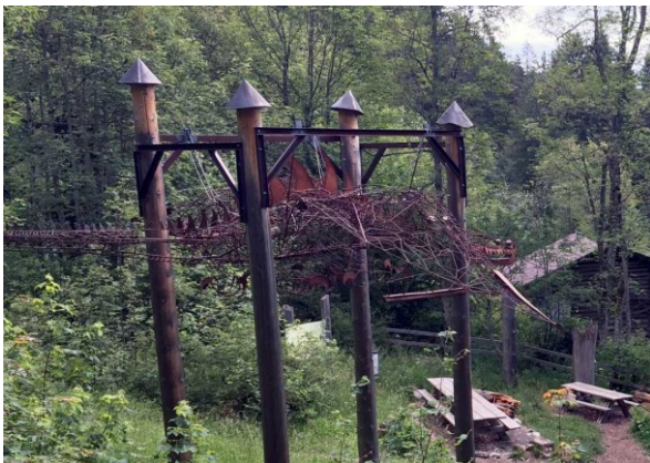
... zum Drachen-Picknickplatz.