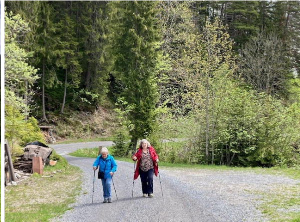
über das Rischere Bödeli und durch den Spirewald...