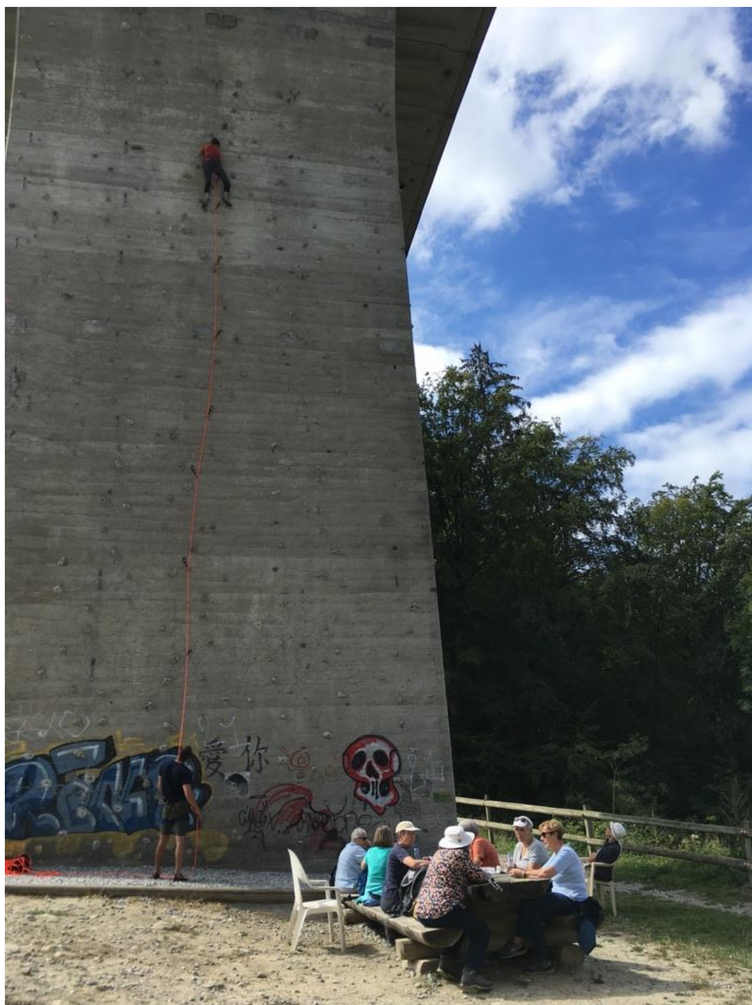
Picknick in Les Rittes unter der Pérollesbrücke