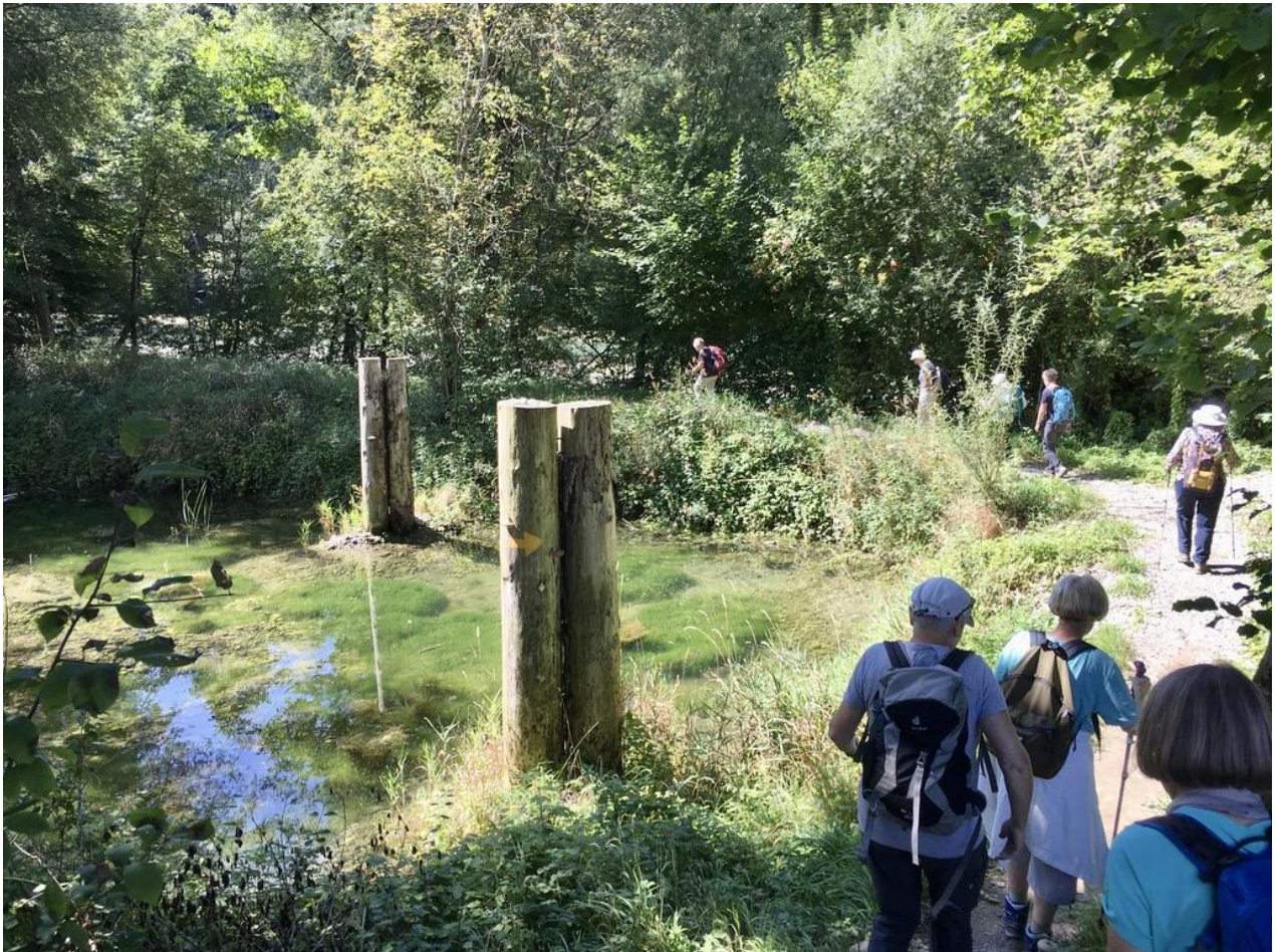
Wir nähern uns der Zisterzienser-Abtei Hauterive