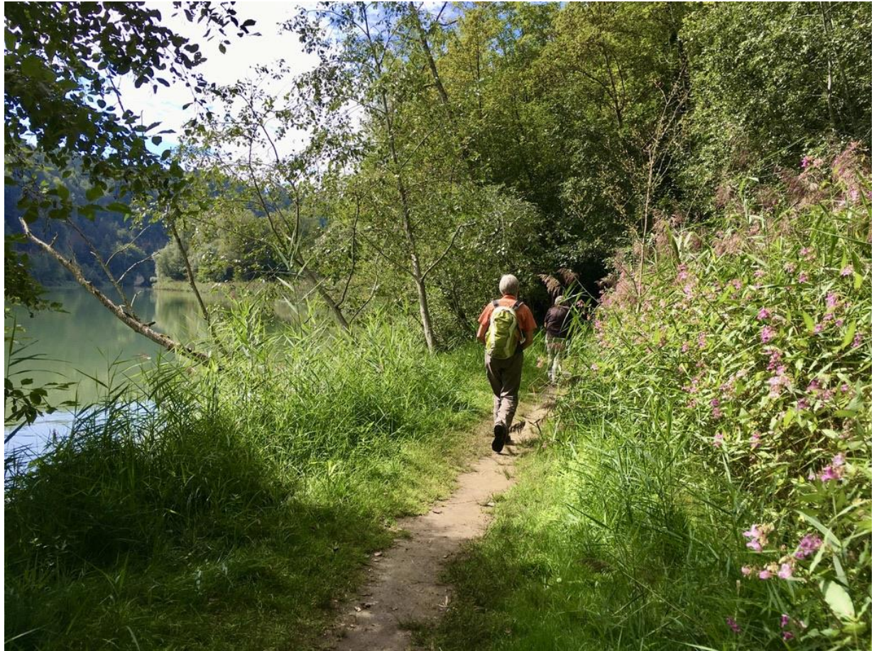
Der Saane entlang