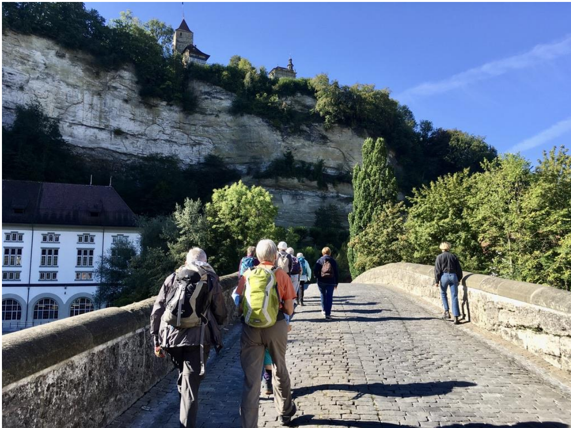
Abstecher in die Altstadt von Freiburg