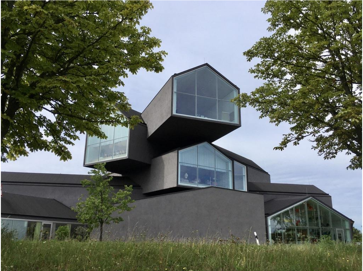
Führung durch die Ausstellung «Home Stories» im Vitra Design Museum