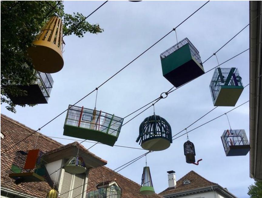
Vogelkäfige mit ausgeflogenen Bewohnern