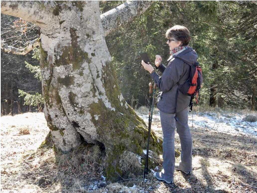
Was meint das Pflanzenapp?