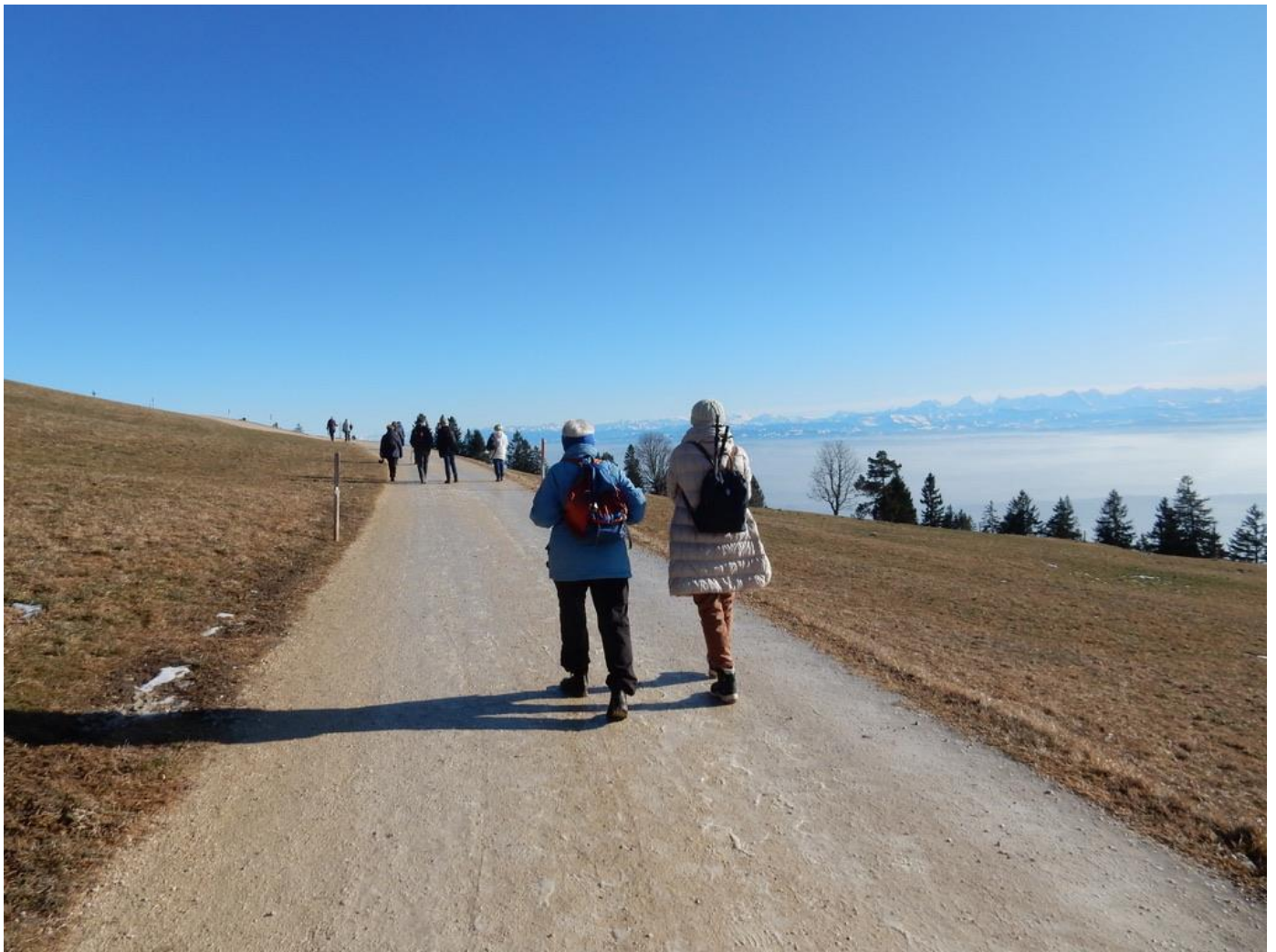
Bevor wir wieder talwärts gondeln, geniessen wir nochmals den prächtigen Tag