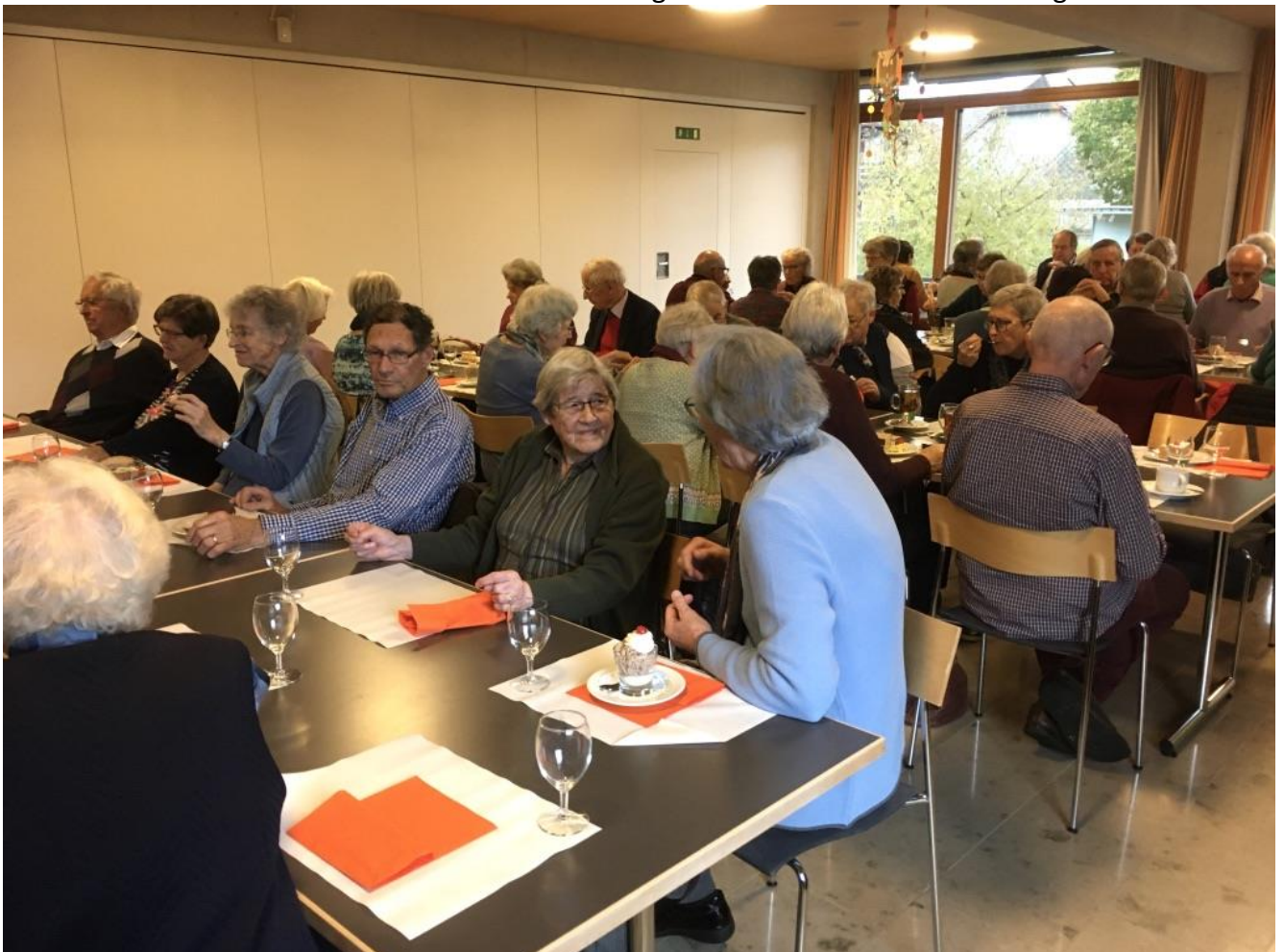
Im Turmhus lassen wir den Nachmittag bei einem feinen Zvieri ausklingen