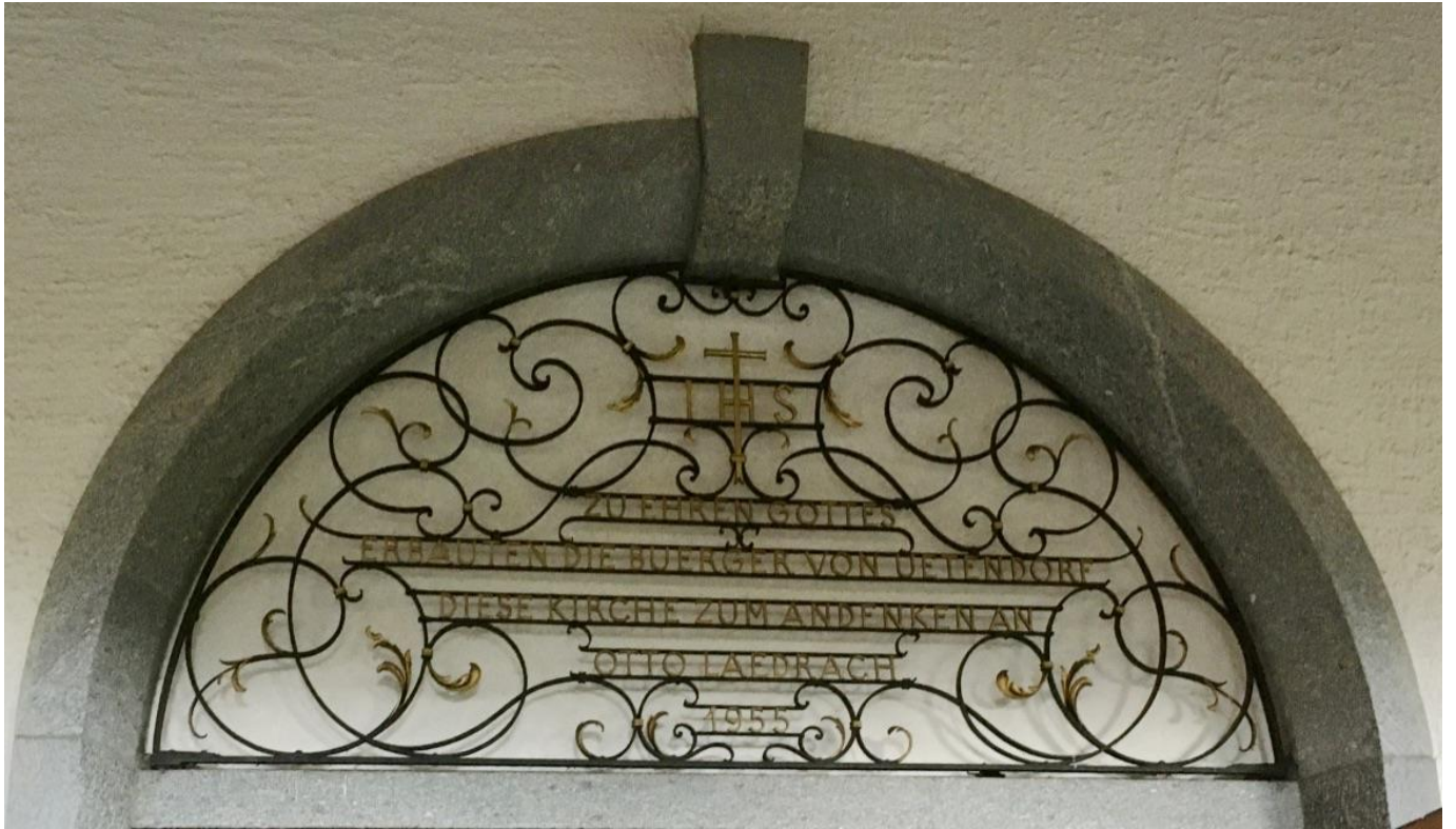
Über dem Kirchenportal erinnert dieser Text an Otto Lädach