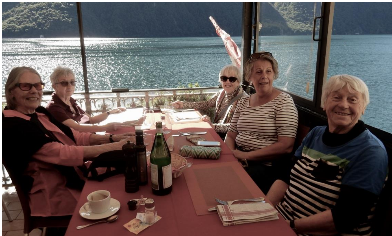
Während sich die einen am See mit einem feinen Fisch-Essen verwöhnen lassen und anschliessend per Schiff zurück nach Lugano fahren....