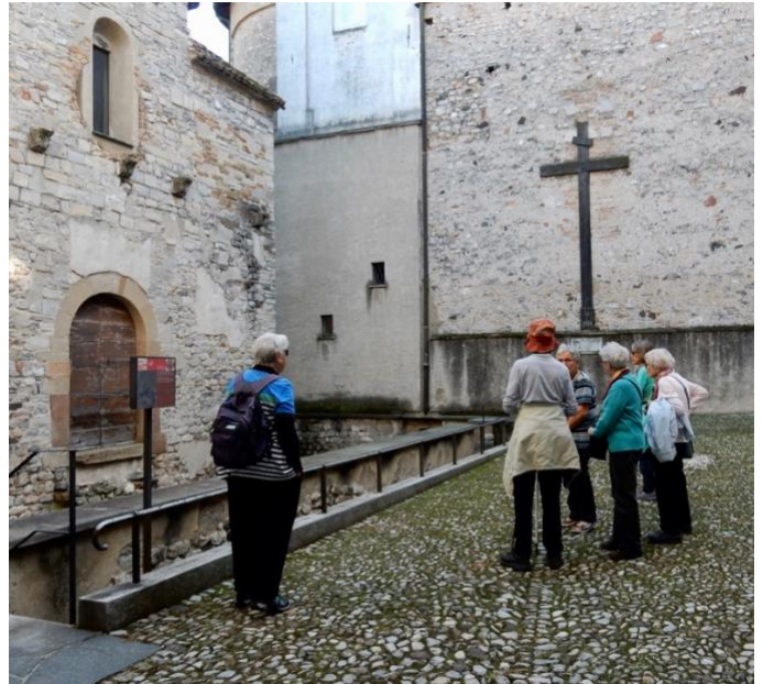
Monolythisches Becken über dem Originaltaufbecken