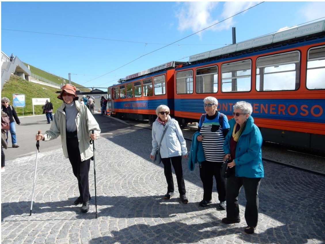
Fahrt auf den Monte Generoso