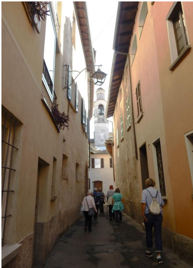
Baptisterium Riva San Vitale (ältestes chr. Bauwerk der Schweiz)