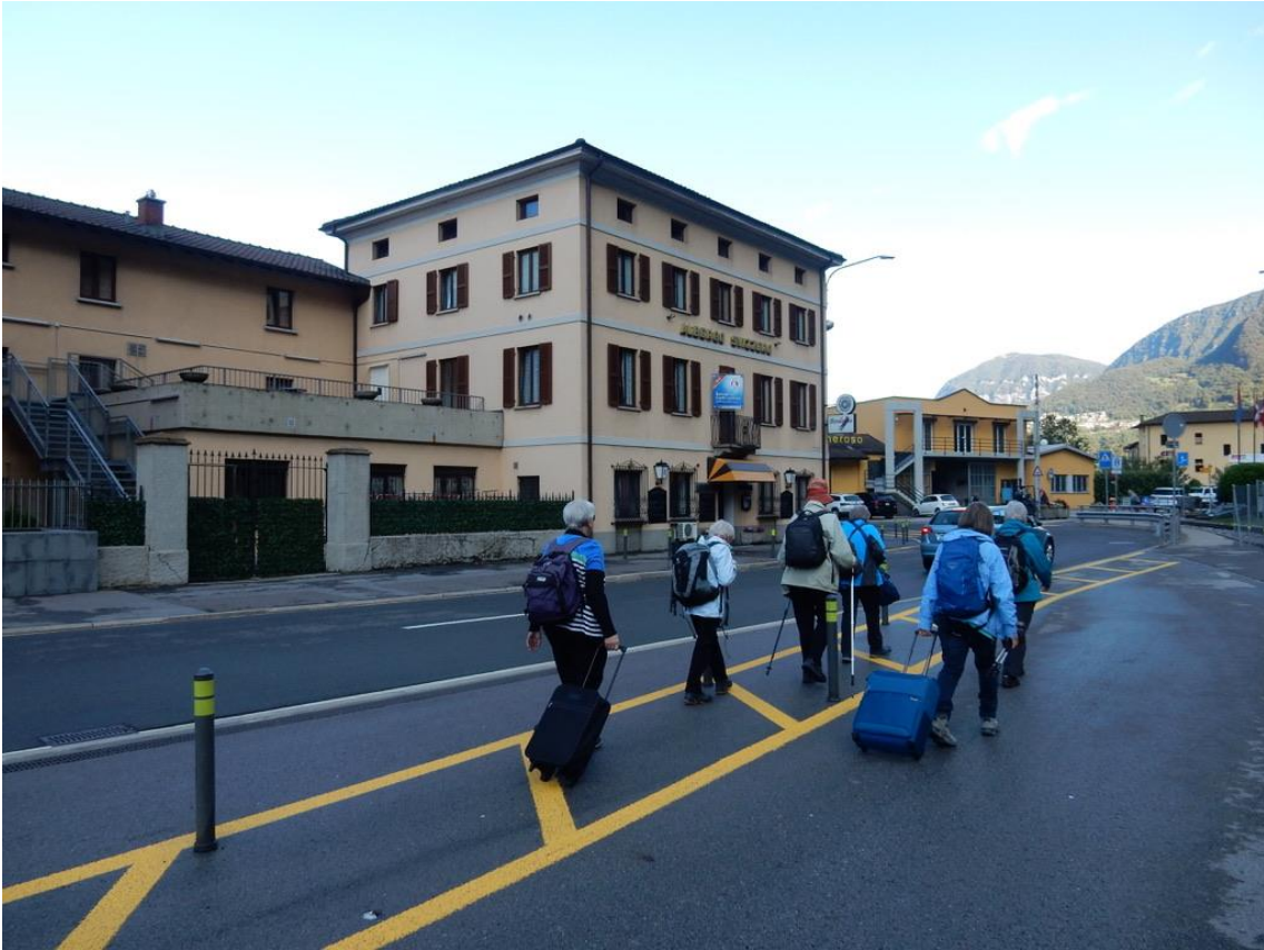
Ankunft in Capolago im Albergo Svizzero