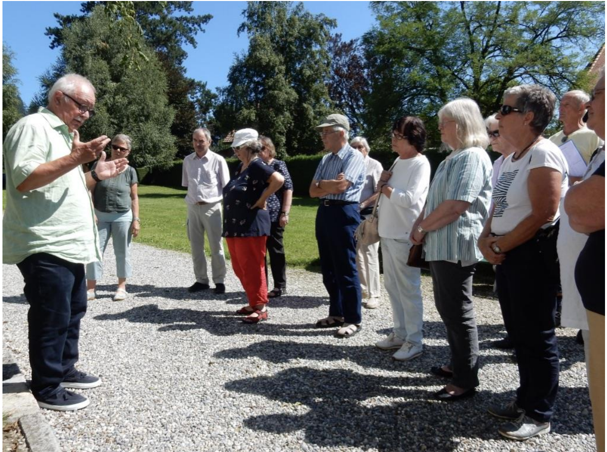
und hinein ins Gotthelf-Museum