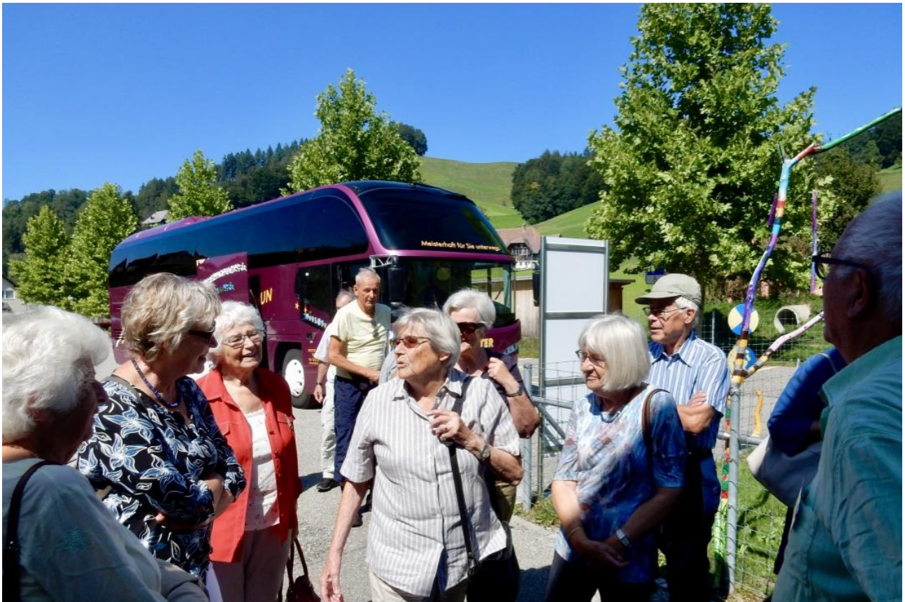
Ankunft in Lützelflüh