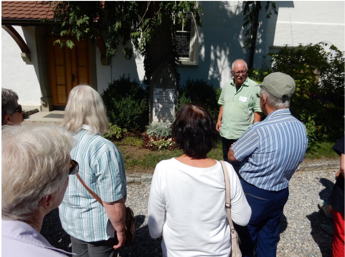
am Grab vorbei