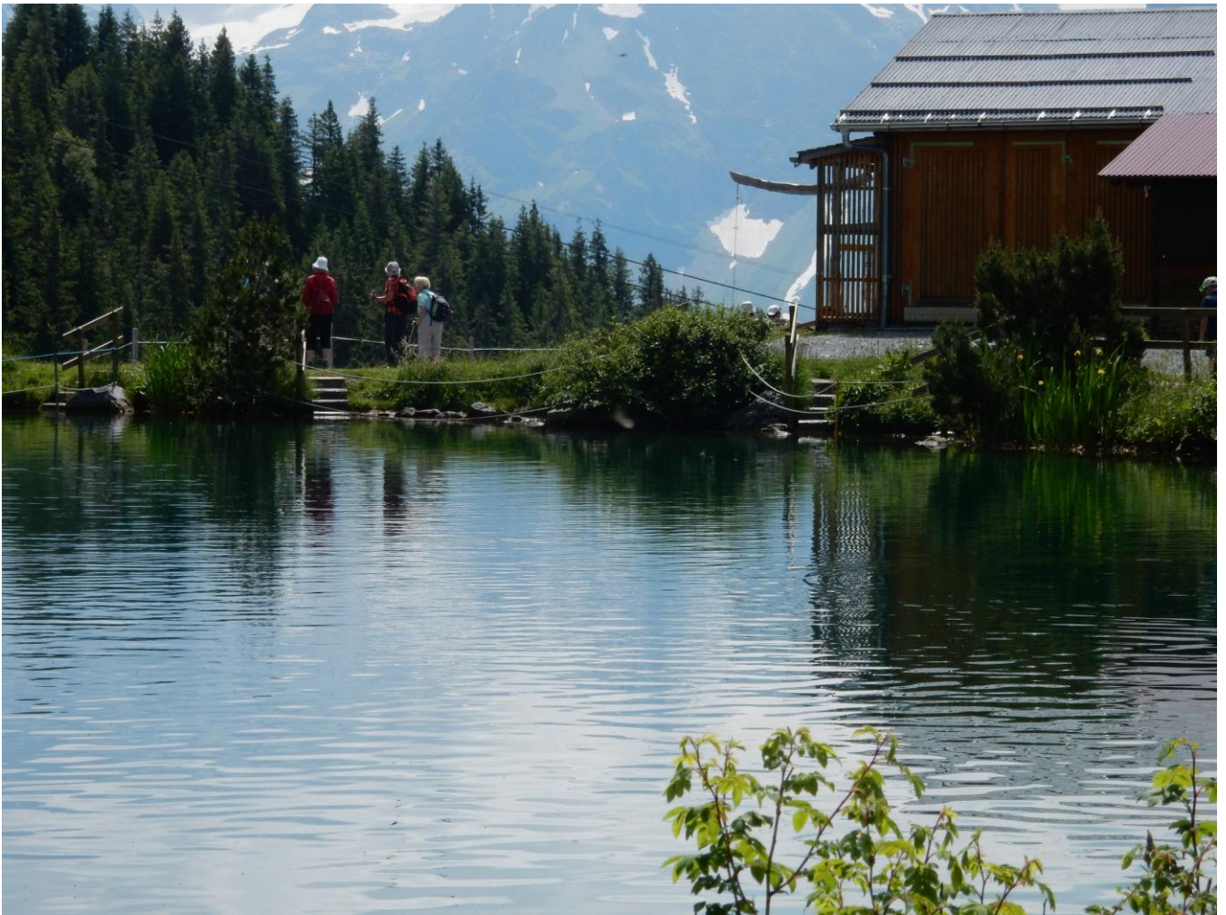
Mittagsrast auf der Brunnialp