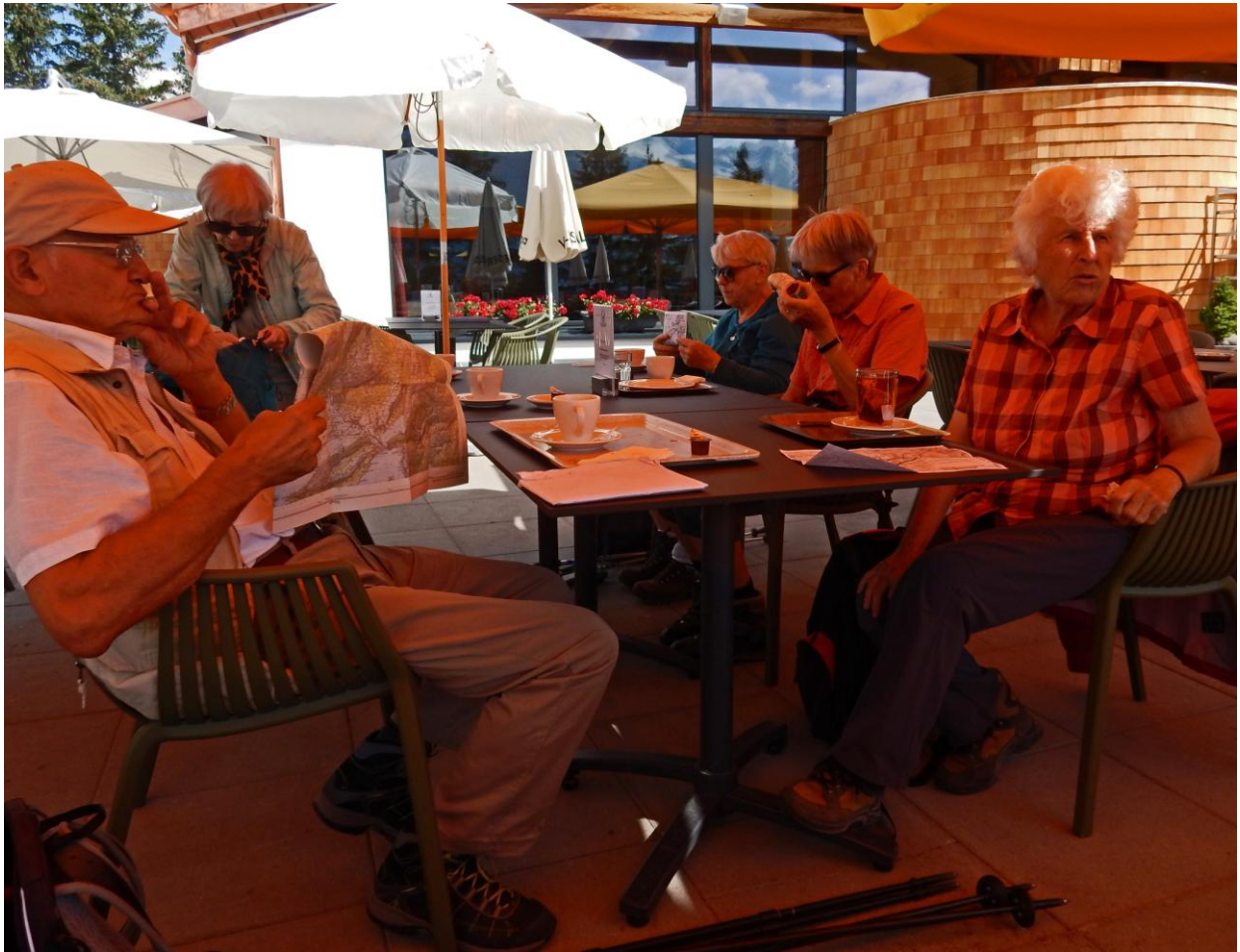
Startkaffee im Berghaus Ristis

17.07.2019 Auf dem Brunnipfad oberhalb von Engelberg