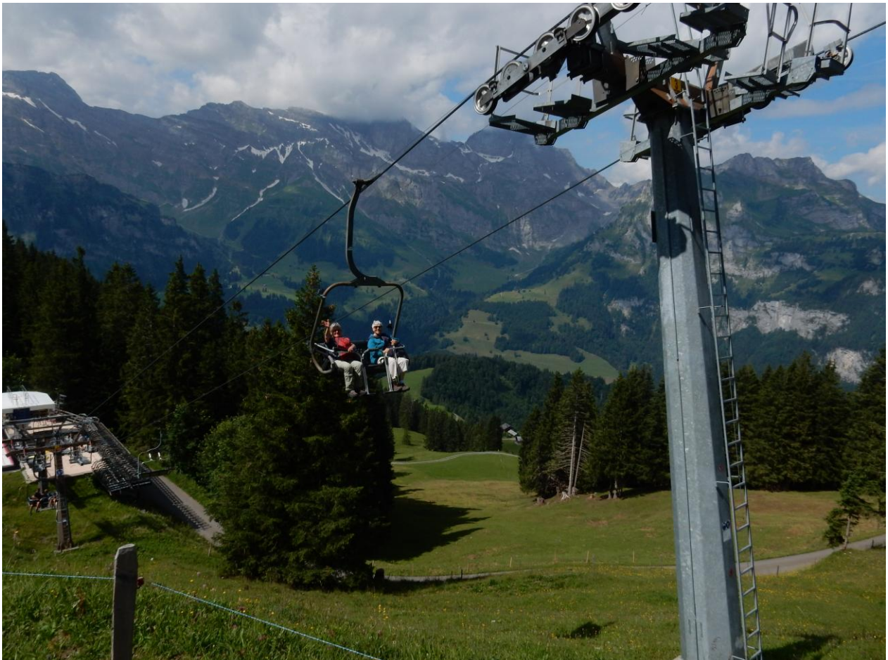
Einige fahren mit dem Sessellift zur Brunnialp