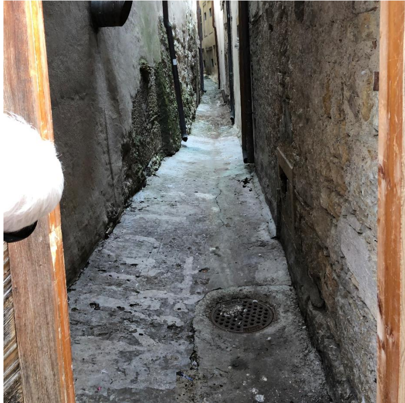
Kurzer Blick in den Ehgraben