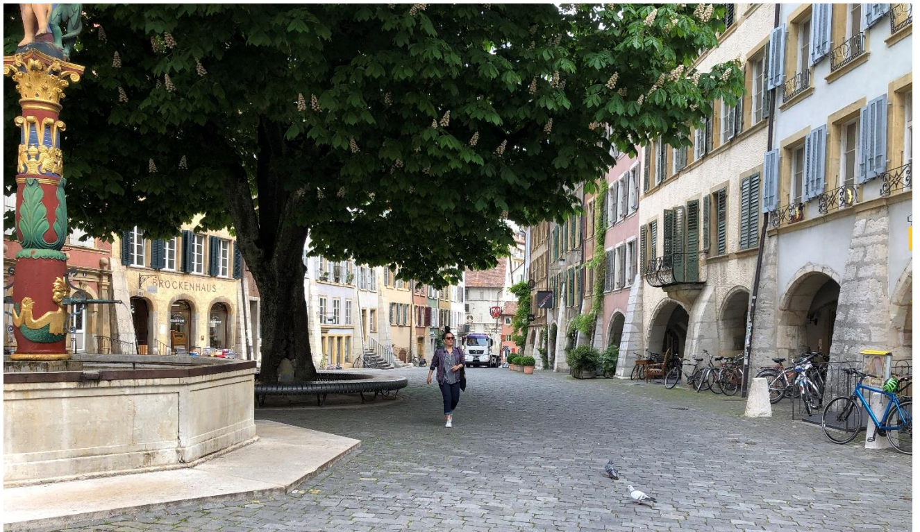
Links die «Neuenburger Seite» mit gelbem Sandstein- rechts die «Berner Seite» mit den typischen Lauben