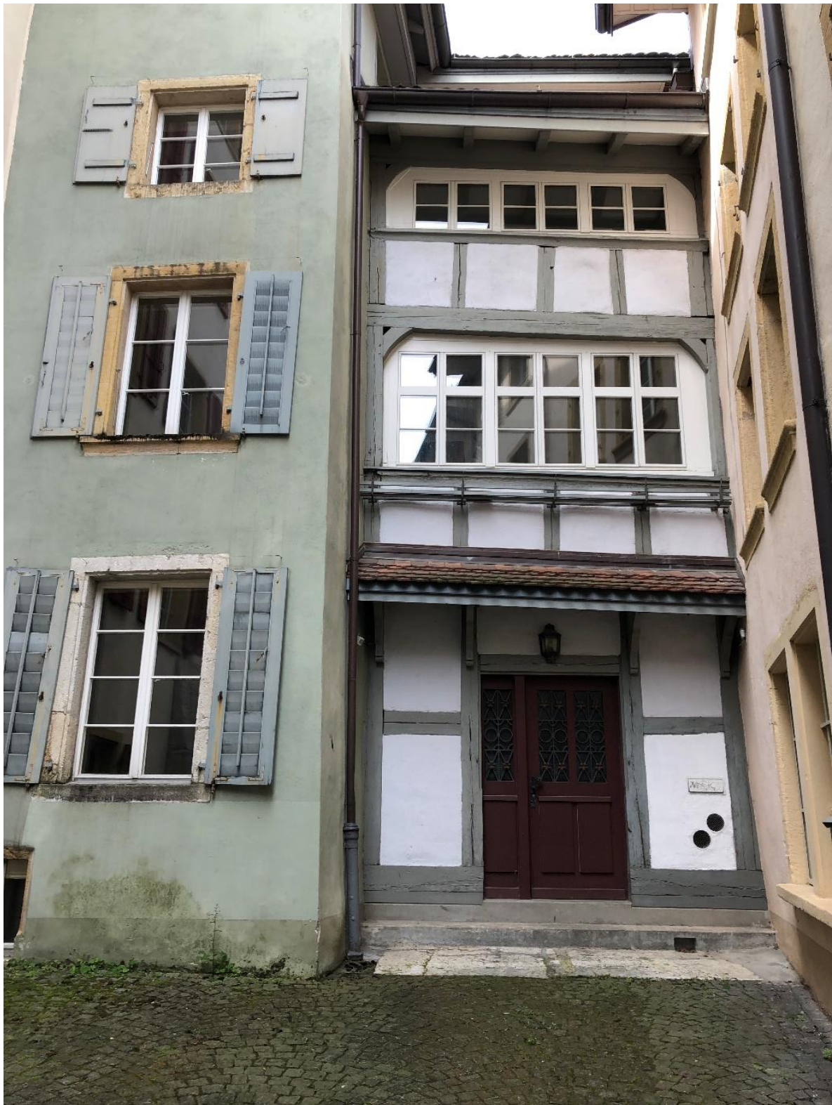
Verdichtetes Bauen- keine neue Erfindung